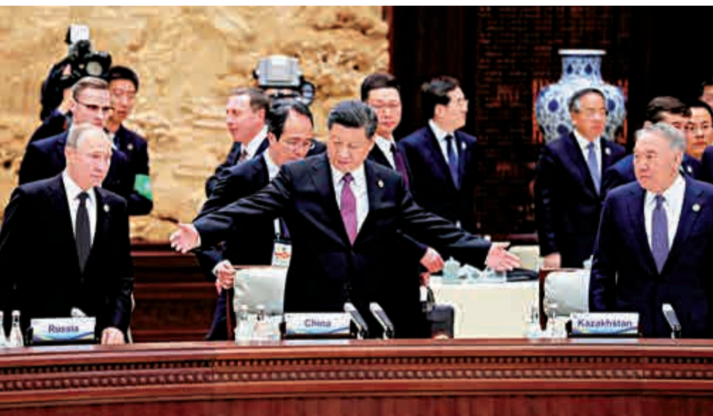
▲中國國家主席習近平主持圓桌峰會並致開幕辭

丘偉基還透露，牙方將繼續高速推進兩國在基建、產能、「藍色經濟」等方面的合作。2008年牙買加短跑運動員博特在北京奧運會上戰成名。丘偉基大使感嘆：「中國企業讓牙買加歷史上第一次在短短三年內建成了一條高速公路，中國才是一個「飛人」！」