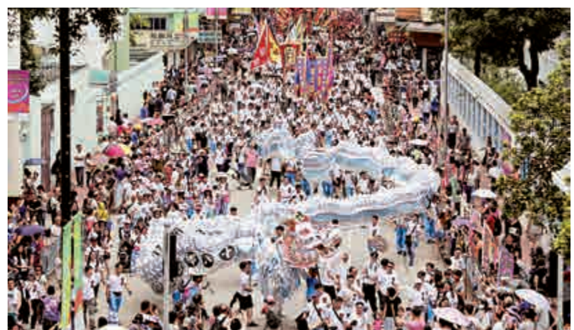
▲38支來自各鄉、堂的花炮隊伍和舞龍舞獅穿梭在元朗市中心各主要道路

【大公報訊】昨日是農曆三月廿三「天后寶誕」，各區天后廟香火鼎盛，並舉辦不同的慶祝活動，而全港規模最大的則是「2019元朗十八鄉天后寶誕會景巡遊」。38支來自各鄉、堂的花炮隊伍和舞龍舞獅穿梭在元朗市中心各主要道路，據介紹，巡遊規模是過去60年最盛大，大會表示約萬人觀看巡遊；巡遊以「英歌隊」打頭陣，有隊員稱表演準備半年；沿途大批市民夾道觀賞，有人朝早八時霸位，稱摸龍身祝願一家平安。