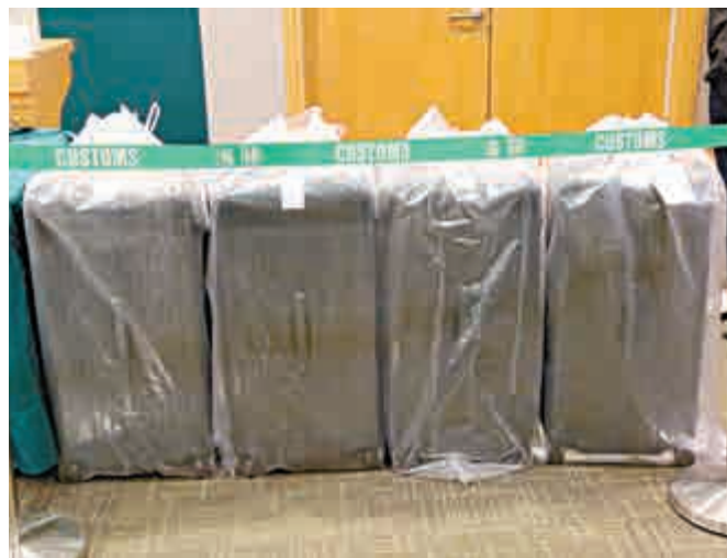
▲毒販將毒品藏在價值逾萬元名牌行李箱走私到香港