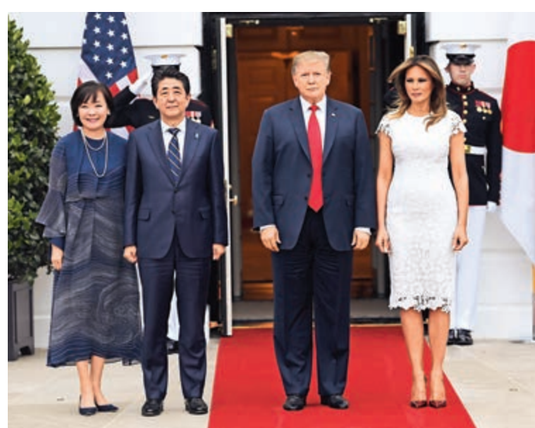
▲美總統特朗普（右二）26日接見了日本首相安倍晉三（左二）

另外，安倍此次外交訪遇上的尷尬事不止一樁，加拿大總理特魯多28日接見安倍時，雙方討論了如何進一步發展商業關係，但會上特魯多數次口誤，將日本稱為中國，還將「日加關係」不小心說成「中加關係」。加拿大媒體CBC調侃道，特魯多會見安倍，滿腦子想的卻是中國。