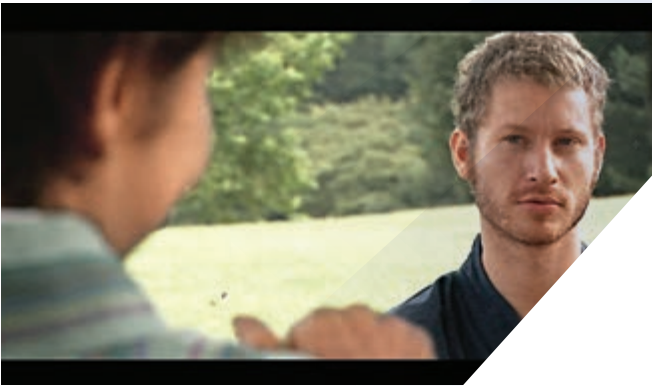
▲《手語基因》是一部以先天性聾人為主角的科幻片

導演、演員和製片人」，不會選擇的則有兩類影片，其一是「教育聾人要學會讀唇」，其二是「用健聽人士扮演聾人，並塑造聾人的刻板形象」。