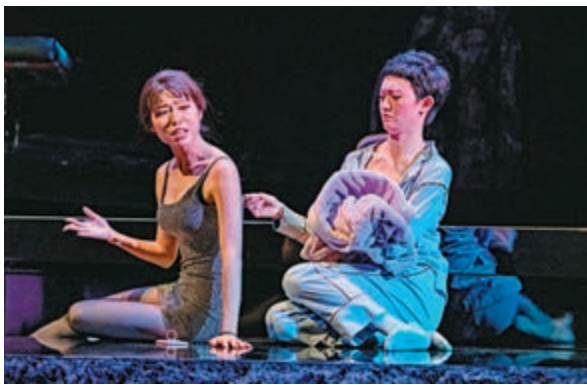
▲Cindy（左）是經常飛翔天空的無根女性

全劇的想像空間來自一個太空人角色（陳矯飾）。編劇擬定了中國航天員（太空人）能夠踏足月球，不單發現多年前其他國家太空人的足跡，更為中國航天事業帶來突破性發展。這段虛擬情節穿梭全劇不同場口，似乎並非刻意深究不同國家如何在太空爭逐中獲得驕人成績，而是藉着太空人的飄渺形象，具體呈現Jason的內心世界。導演在不同情境將太空人與角色連繫，甚至在