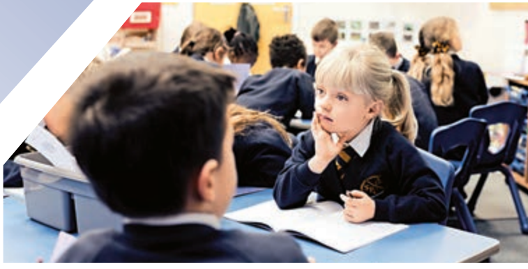
▲開幕電影《沉默的孩子》劇照