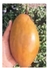
黃金巨無霸百香果