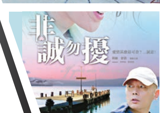
內地電影《非誠勿擾》以輕鬆幽默基調，講述一位海歸微婚的故事，票房不俗