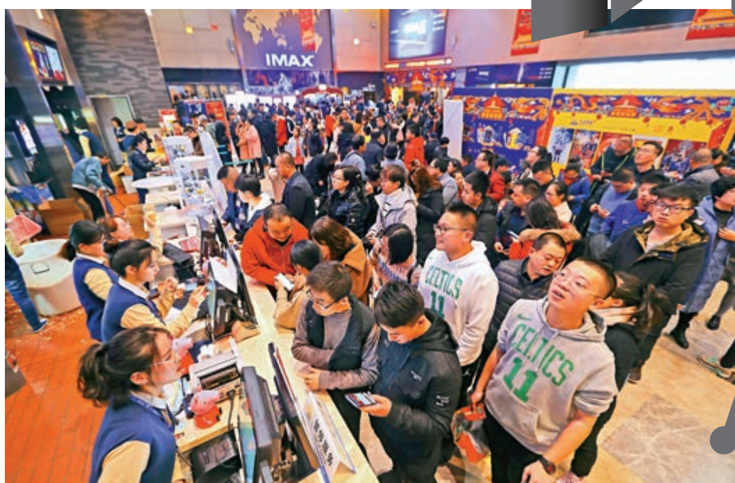
隨着內地消費升級，預期電影行業將可處於穩定上升的狀態