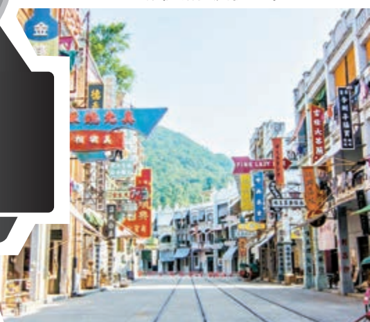
國藝娛樂持有的樵山國藝影視城位於佛山市