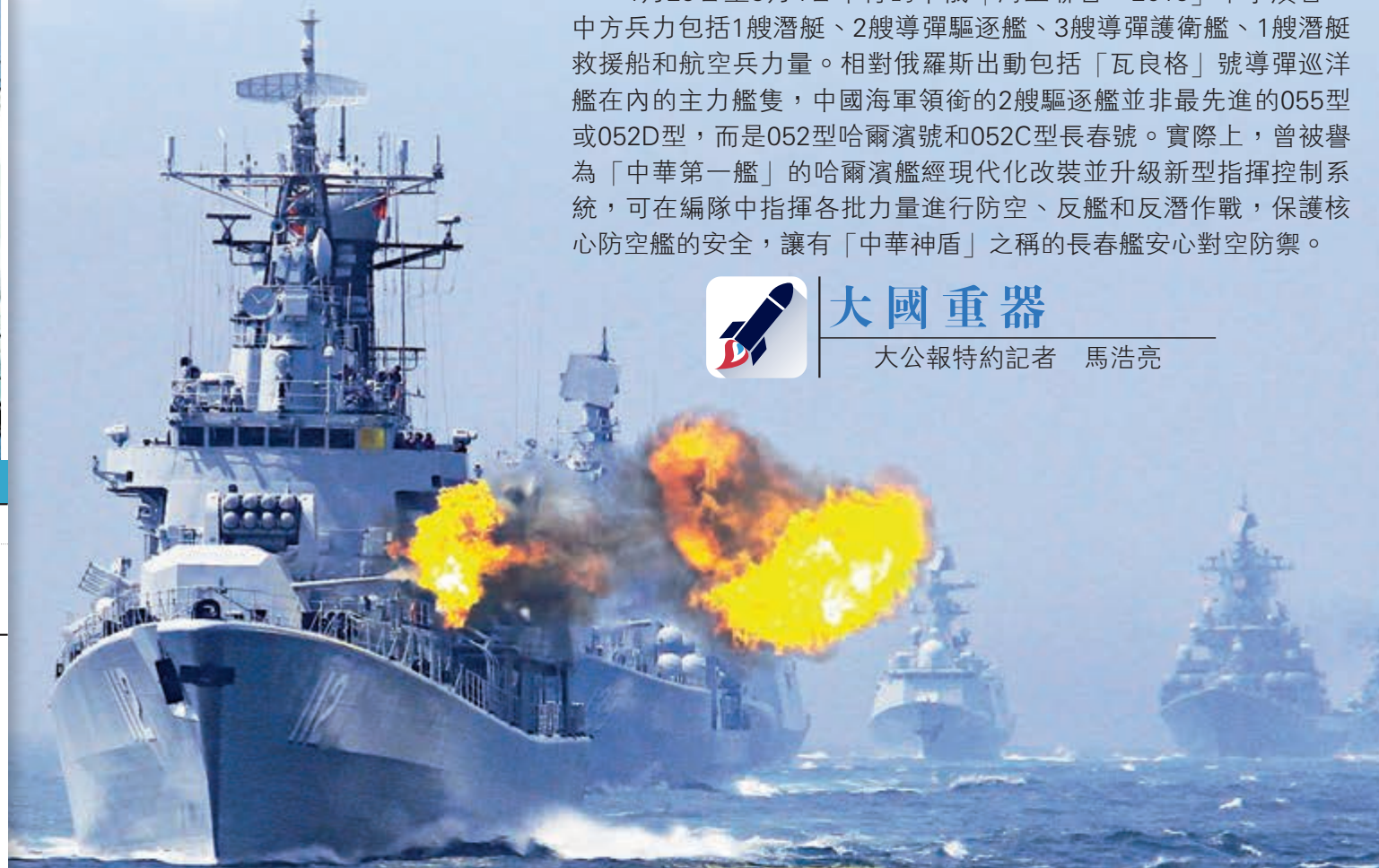
▲哈爾濱艦經現代化改裝並升級新型指揮控制系統，可在編隊中指揮各批力量進行防空、反艦和反潛作戰 資料圖片