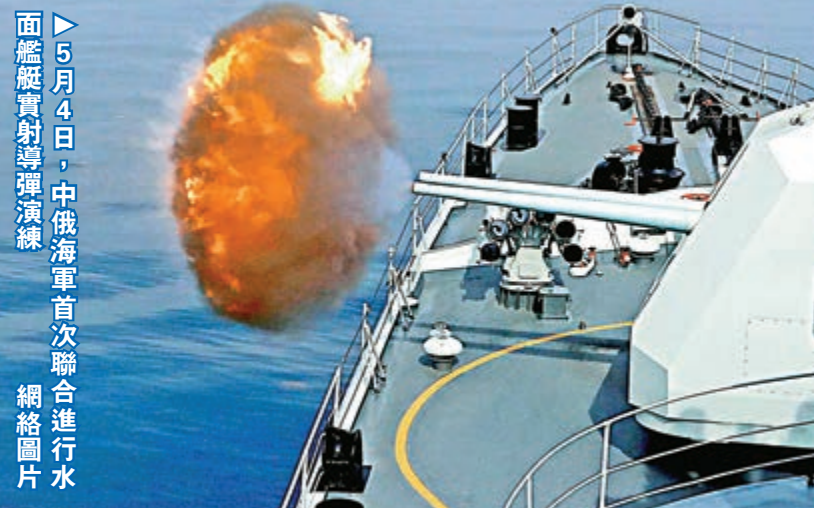
▶5月4日，中俄海軍首次聯合進行水面艦艇實射導彈演練