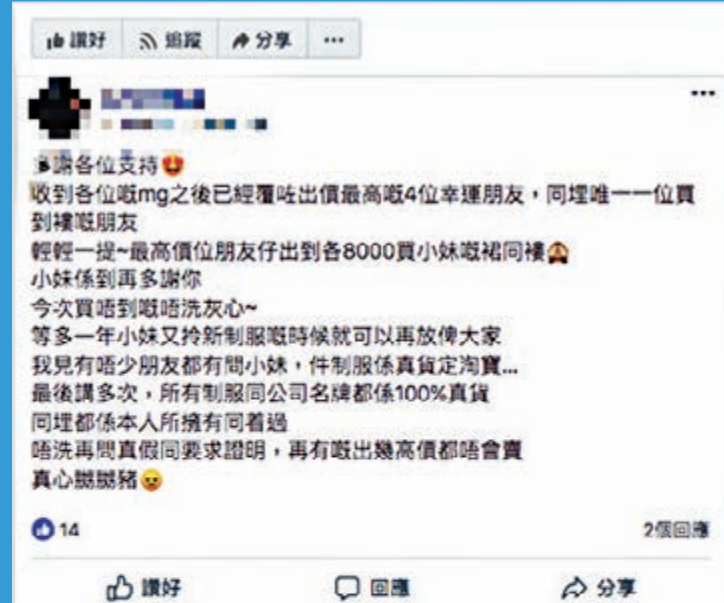
▲「空姐」在成功賣出多件制服後，高調出帖子感謝買家，並向其他網友承諾在明年領取新制服時，會再有空姐制服出售