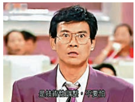
▲港股昨日暴瀉，股民大嘆難逃應驗「丁蟹效應」

資料顯示，1994年11月播放的《笑看風雲》，其間恒指最多跌幅達20.5%，還有1997年12月的《江湖奇俠傳》，月內恒指最多跌26.4%。