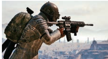
▲騰訊《絕地求生》遊戲遲遲未能獲批商業化