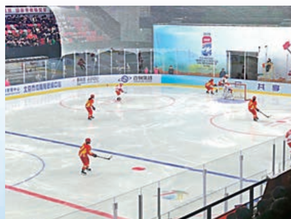
▲「四塊冰」早前舉辦冰球比賽