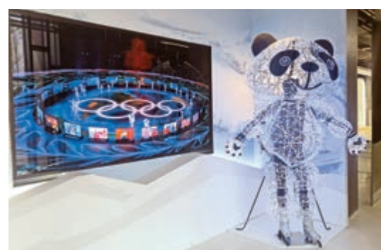
▲平昌冬奧開幕式上，「北京時間」表演者穿的發光熊貓服