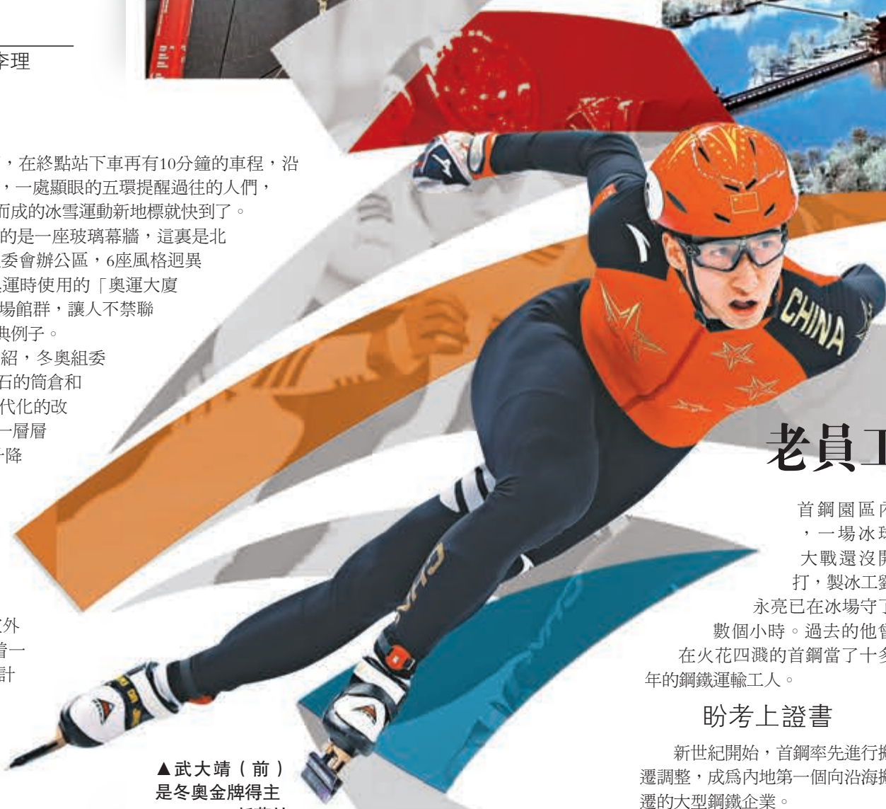
▲武大靖（前）是冬奧金牌得主