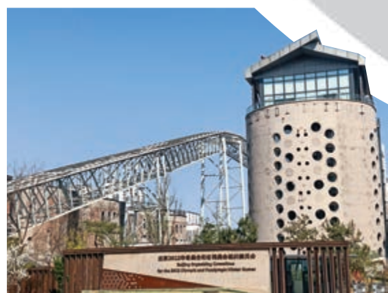
▲北京冬奧組委會坐落在筒倉中

在場館內，參與觀衆服務和設施維護的工作人員也是首鋼的老員工，不少人都向大公報記者說，是冬奧給了他們人生改變賽道的機會，從原來的煉鋼工人改行到充滿朝氣的體育產業中。