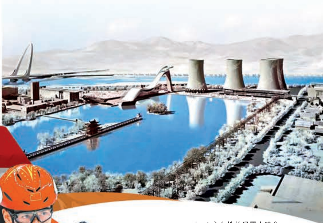
▲永久性的滑雪大跳台，背後屹立着4座冷卻塔