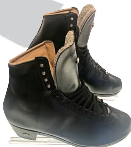
▲姚明拍攝冬奧申辦宣傳片時穿的冰鞋