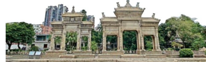
在「珠海十景」中佔有一席位的梅溪牌坊

中國駐夏威夷第一任領事，官居二品。從珠海走向世界的陳芳，落葉歸根後熱心於家鄉公益事業，梅溪牌坊正是光緒帝為表彰陳芳及其父母等人造福家鄉而賜建的。今天，景區設置了「陳芳家史展」、「中國牌坊精品展」、「珠海名人蠟像館」等展覽，讓遊客直觀感受晚清至今珠海名人對近代中國史都產生過深遠的影響。