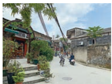
古鎮猶存的唐家灣古鎮

與香港大嶼山隔海相望的唐家灣古鎮，將濃厚的歷史感和現代的文藝小清新結合在一起。行走在唐家灣，體驗珠海的慢城生活和海洋