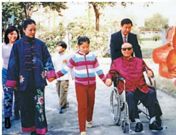
習近平推着坐輪椅的父親習仲勳，在妻子、女兒陪伴下一起散步