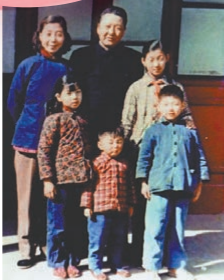
▲1959年，習仲勳、齊心夫婦與子女在一起。資料圖片

「一家仁，一國興仁。」孝老愛親、愛國愛家、相親相愛。在習近平的引領下，在擁有十幾億人口的中國，好的家風正匯聚成一股雄渾之力，為人民的美好生活添彩，為中華民族復興助力。