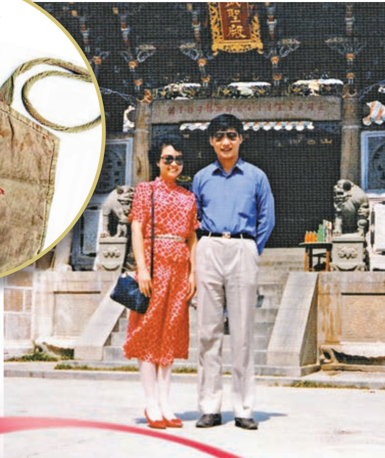
習近平和妻子彭麗媛在福建東山島