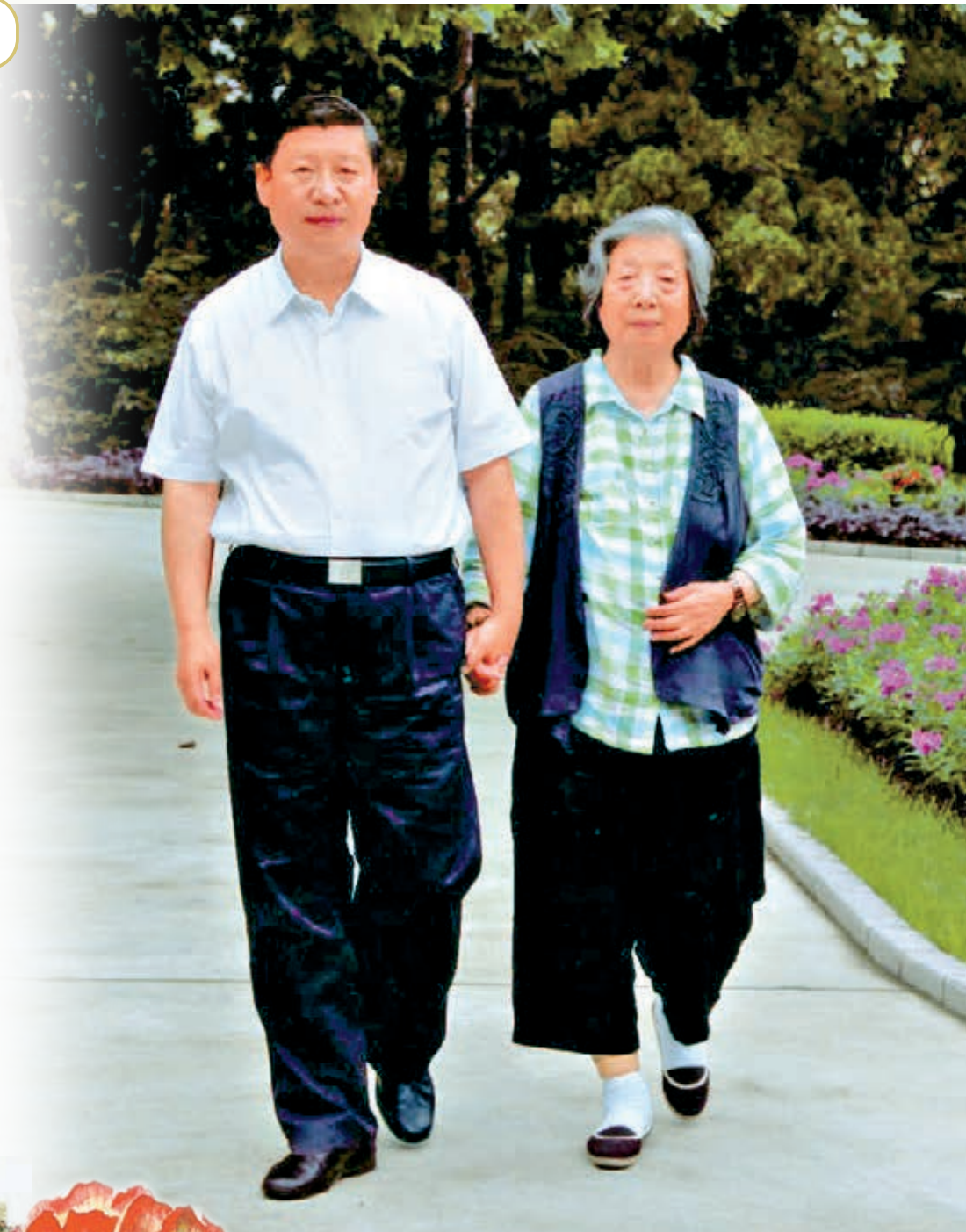
習近平牽着母親齊心的手漫步在公園中