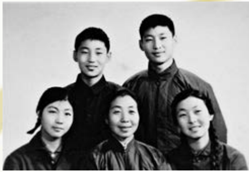
▲一九七二年冬，齊心（前排中）與子女在一起。

【大公報訊】國家主席習近平的辦公室裏，一直都擺放着這樣一張照片：公園中，習近平緊緊握着母親的手，兩人一起悠閒地散步，臉上的表情寧靜而祥和。作為母親，孩子平安喜樂，便是最大的欣慰。而母親齊心對於習近平的期望，更多了一份對國家和對人民的責任與擔當。牢記母親教誨、不負祖國和人民的期望，這是最深的牽掛，是最大的擔當，同時也是習近平送給母親最好的「禮物」。