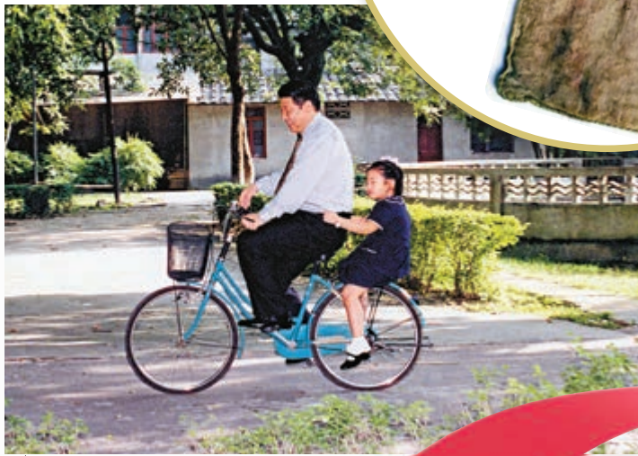
習近平在福州時騎自行車帶女兒玩