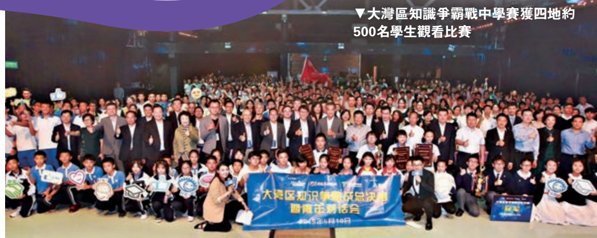
▼大灣區知識爭霸戰中學賽獲四地約500名學生觀看比賽