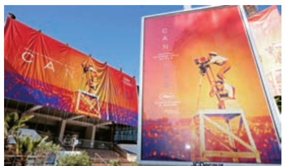
▲本屆影展海報紀念艾麗絲華妲(Agnes Varda)

大會選用了這照片作海報，非常醒目。一方面，他們以照片悼念這位重要的法國女導演，亦以她取代過往幾屆以明星為主的設計，將影片的焦點從璀璨星光帶回電影創作的層面。此外，照片中華妲跟助手站在高台上，架著攝影機，予人高高在上，甚至撐起半邊天之感，展示大會支持女性電影的意圖，可謂一舉三得。