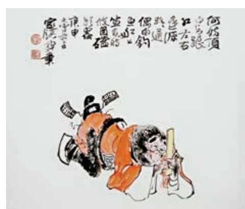
▲鄭家鎮漫畫作品《沐猴而冠之磕頭蟲》