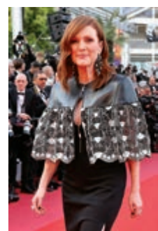
▲美國女星茉莉安摩亞現身競賽電影《Les Misérables》的首映