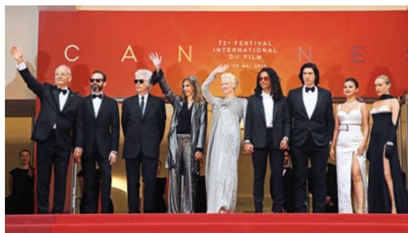
▲《喪屍不死》導演占渣木殊(左三)率領演員出席康城影展開幕儀式