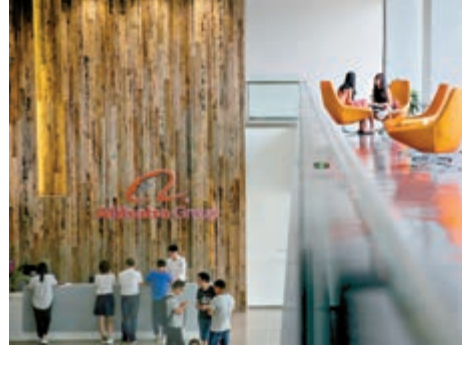
阿里巴巴設立「經濟體發展執行委員會」，統一所有經濟體的戰略。

權保護年度報告》，顯示阿里巴巴去年共向執法機關推送涉嫌侵權的線索1634條，協助搜捕涉嫌侵權者1953名，溯源打擊涉案金額人民幣79億元人民幣。