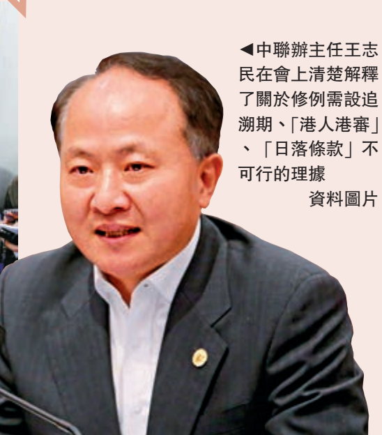
▲中聯辦主任王志民在會上清楚解釋了關於修例需設追溯期、「港人港審」、「日落條款」不可行的理據 資料圖片