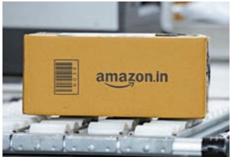
▲亞馬遜目前所用網絡域名仍不是頂級域名amazon

巴西外交部在一份聲明中表示，巴西對ICANN的決定感到遺憾，並表示它本應選擇共同管理該域名。