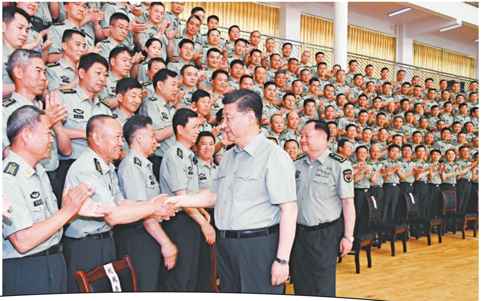
5月21日，中共中央總書記、國家主席、中央軍委主席習近平到陸軍步兵學院視察。這是習近平親切接見駐江西部隊副師職以上領導幹部和建制團級單位主官、陸軍步兵學院本部正團職以上幹部和石家莊校區主官、專家教授代表。

【大公報訊】中共中央總書記、國家主席、中央軍委主席習近平21日到陸軍步兵學院視察。他強調，軍隊院校因打仗而生、為打仗而建，必須圍繞實戰搞教學、着眼打贏育人人才。要傳承紅色基因，深入貫徹新時代黨的強軍思想，深入貫徹新時代軍事戰略方針，面向戰場、面向部隊、面向未來，走內涵式發展道路，強化政治保證，把辦學定位，深化改革創新，全面提高辦學育人水平，為強軍事業提供有力人才支持。