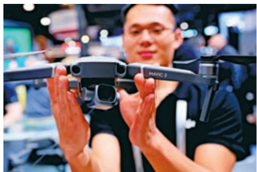
▲在美國拉斯維加斯消費電子展上，工作人員展示大疆無人機

過去十幾年，大疆先後經歷了飛控升級、消費升級以及近幾年工業級應用的升級，在全球開啓了「天地一體」影像新時代，重塑人們的生產和生活方式。