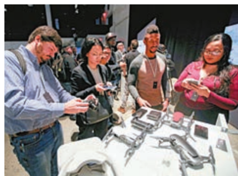
▶在美國紐約，大疆新款無人機受到歡迎 資料圖片

2017年 ●大疆全球營業額達到了180億元人民幣，海外收入佔總收入的80%，其中北美地區是第一市場，第二大市場為歐洲。大疆暫未披露2018年營收情況