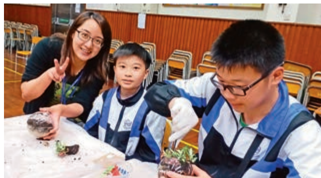
▲基新中學舉辦「頌親恩」活動，同學們學習製作迷你玻璃盆景，作為送給雙親的禮物

在五月七日下午，中一級全體學生分批進行活動，由該校校友、義工及家長等十多人帶領，先在課室自製心意卡，答謝父母親多年來的關懷和愛護。其後，聚首本校禮堂，學習製作特色小禮物如皮革壓紋手帶、壓花匙扣、迷你玻璃盆景、迷你玻璃鐵塔及乾花花瓶等，作為送給雙親的禮物。