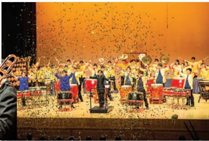
▲管樂團陣容鼎盛，成員默契十足