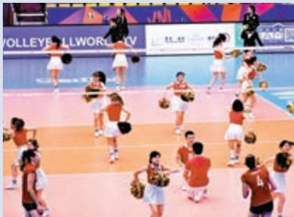
▲啦啦隊隊員在比賽暫停期間表演舞蹈