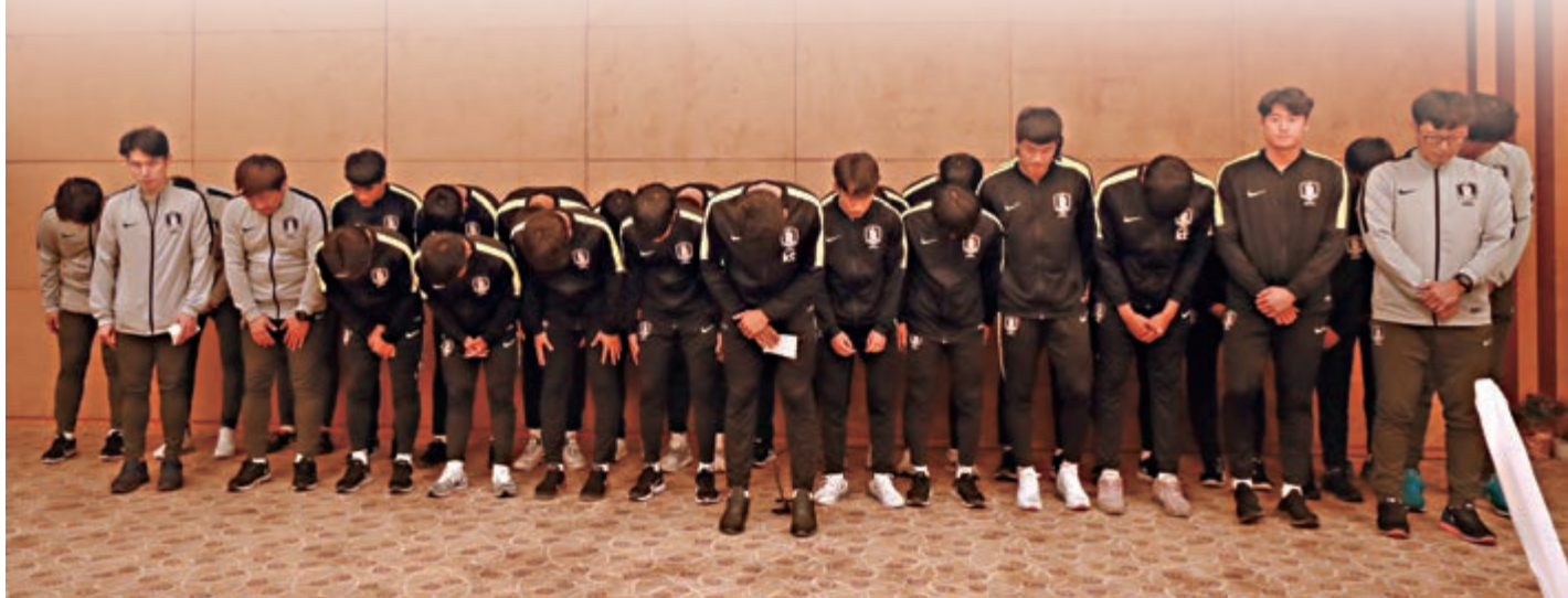
▲韓國隊就隊員侮辱「熊貓盃」賽事獎盃行為致歉

男單次圈，2號種子、西班牙球手拿度迎戰自外圍賽晉級正賽的德國球手馬登，最終拿度輕鬆以6：1、6：2、6：4取勝，拿度15次參加法網正賽都至少打入第三圈。3號種子、瑞士名將費達拿與德國的奧特對賽，結果費達拿以6：4、6：3、6：4獲勝，同樣打入第三圈。