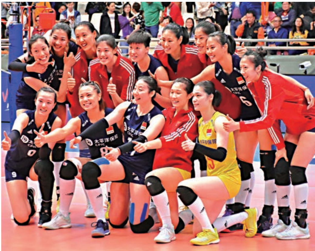
▲中國女排賽後大合照

澳門站結束後，中國隊以4勝2負的戰績排在世界女子排球聯賽積分榜第五位。按賽例，參加今年世界女排聯賽的16支隊伍要經過5站分站賽角逐，最後成績排名前5的隊伍與東道主一起爭奪總決賽冠軍。由於總決賽在南京舉行，中國隊自動獲得總決賽席位。