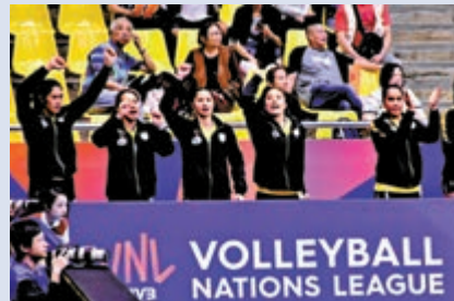
▲泰國隊隊員跟隨現場音樂擺動

國際排聯世界女子排球聯賽為何能夠成為極受歡迎的世界級體育賽事，這不僅僅只是與比賽的可觀程度有關，因為這也仿似一場盛大的嘉年華會。除比賽期間外，場內總是充斥着不間斷的音樂，不僅現場有司儀和工作人員帶領觀眾一同跟隨音樂互動外，場內兩隊的後備球員都會跟隨音樂節奏做出美妙動作，與觀眾一起搖擺、一起互動，球員、觀眾、工作人員一起將比賽現場變成歡樂的海洋。（大公報記者張銳 文、圖）