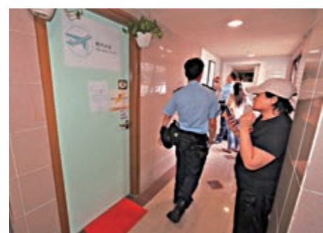
▲驕悅旅遊重門深鎖，貼上結業通告

香港家庭傭工僱主協會主席曹馬珊兒接受《大公報》查詢時表示，僱主有責任向傭工提供交通安排，就算旅行社結業，僱主都要履行提供機票予傭工回家的責任。