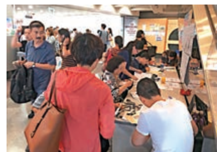
▲新居屋首日收到至少1.6萬份申請

今期發售的何文田冠德苑、長沙灣凱德苑、荃灣尚文苑、將軍澳雅麗苑、馬鞍山錦暉苑及火炭旭禾苑，六個居屋合共提供4871伙，以市價59折發售，介乎156萬至529萬元，房委會預計最快八月「攞珠」，11月揀樓。