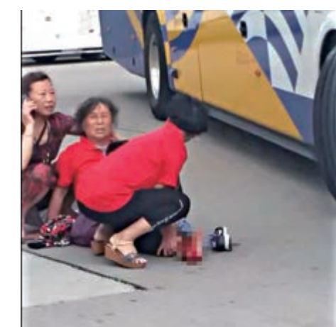
▲六旬女遊客被收掣不及的旅巴前輾過右腳腳掌，地上留有大攤血漬