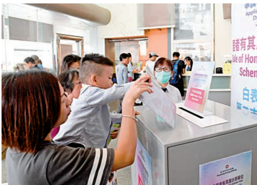
▲新居屋昨日起接受申請，市民爭相到房委會客務中心交表