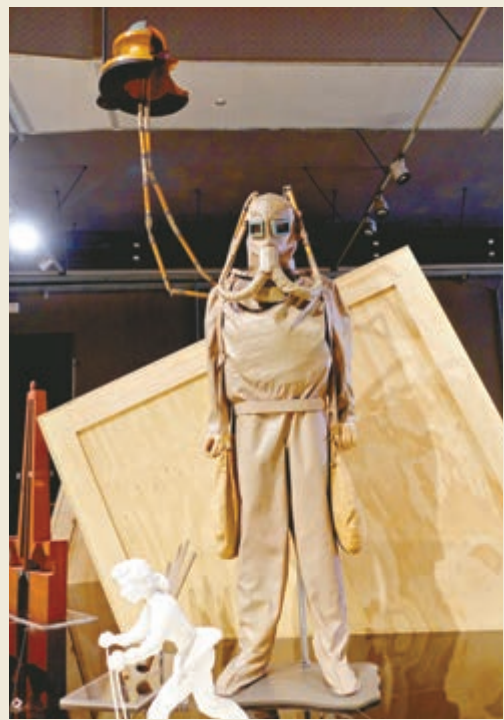
▲達文西設計的潛水服模型