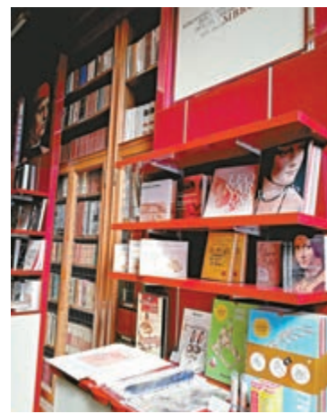
▲有關達文西的書籍、畫冊等