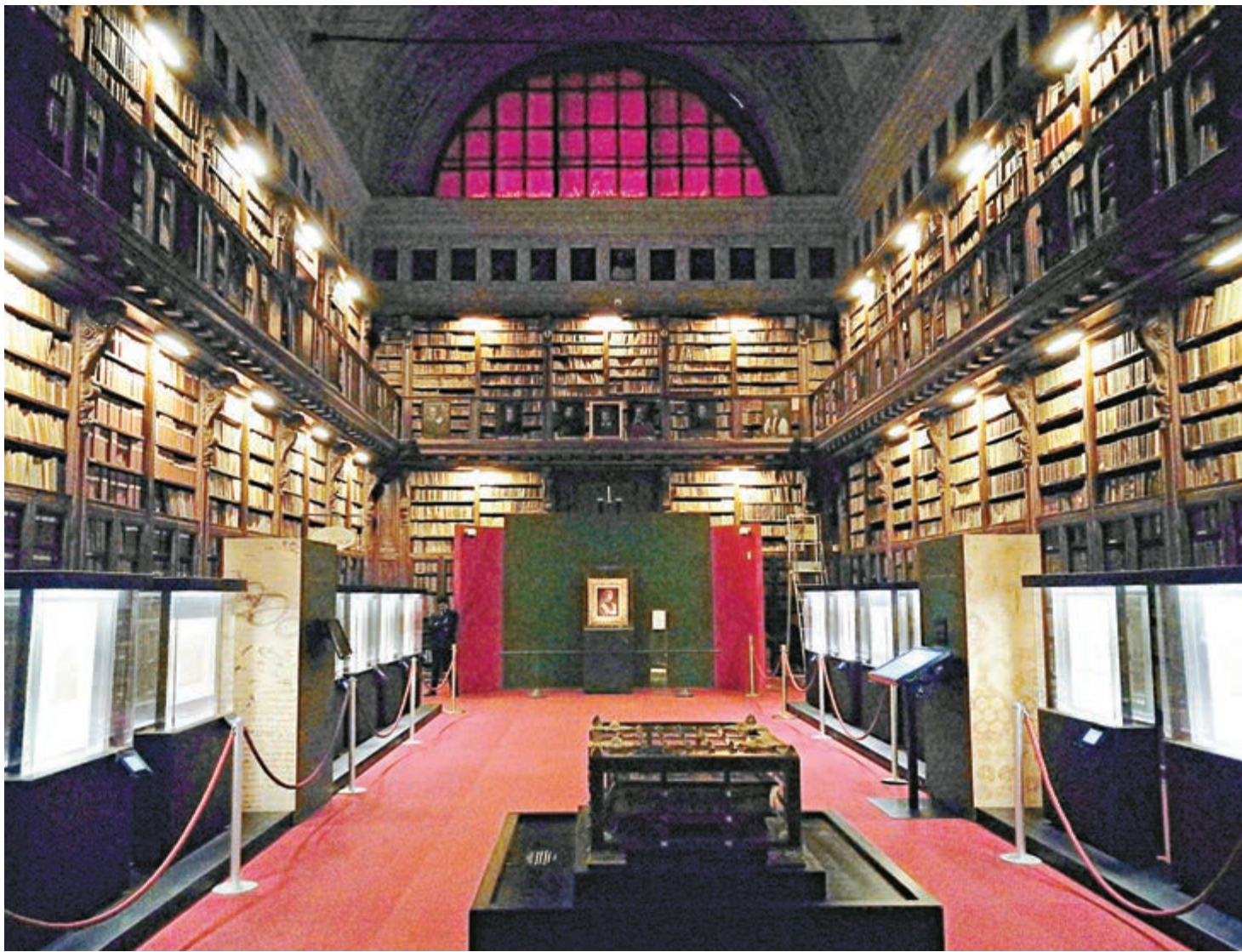
▲安波羅西亞納圖書館中存放着《音樂家肖像》（位於盡頭中央位置）的展廳