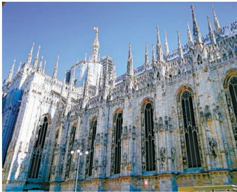
▲米蘭大教堂——達文西為它發明了升降梯

提起米蘭，大多數人首先想到的是意大利高聳入雲的大教堂和時尚前衛的設計，而我此次決定去米蘭是因為達文西（又譯：達芬奇）。2019年恰逢這位意大利文藝復興巨匠逝世五百周年，在他傳奇的一生中，在米蘭度過了二十餘年。如今，這座城市正以它特有的方式紀念達文西，不間斷的展覽和活動貫穿了整個2019年，這也使前來米蘭的遊客們有機會了解達文西與它的不解之緣。