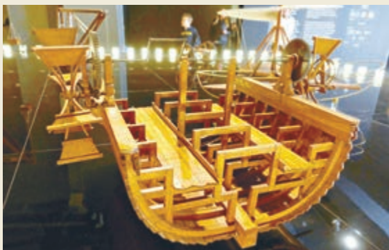
▲達文西為船隻設計的槳輪推進系統模型