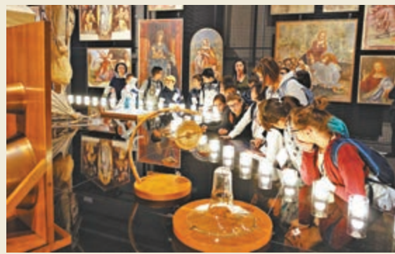
▲學生們正在參觀達文西模型展