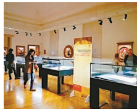
▲安波羅西亞納圖書館的達文西展覽