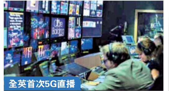
全英首次5G直播 BBC使用5G網絡直播了早晨節目，成為英國首次使用5G信號的電視直播