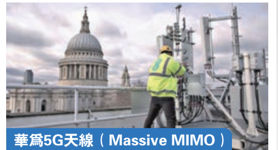
華為5G天線 (Massive MIMO) 英國電訊公司EE的5G網絡主要使用華為的大規模陣列天線設備部署，華為5G Massive MIMO在性能、工程能力等方面目前領先業界，沒有可替代的競爭產品