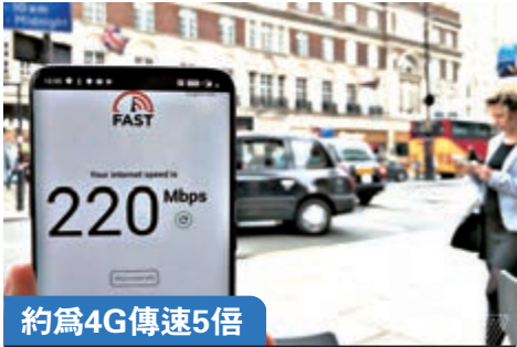
約為4G傳速5倍 客戶可實際體驗到100-150Mbps的5G下載速率，遠高於4G平均30Mbps，部分用戶有機會體驗1GB/s的高速傳輸