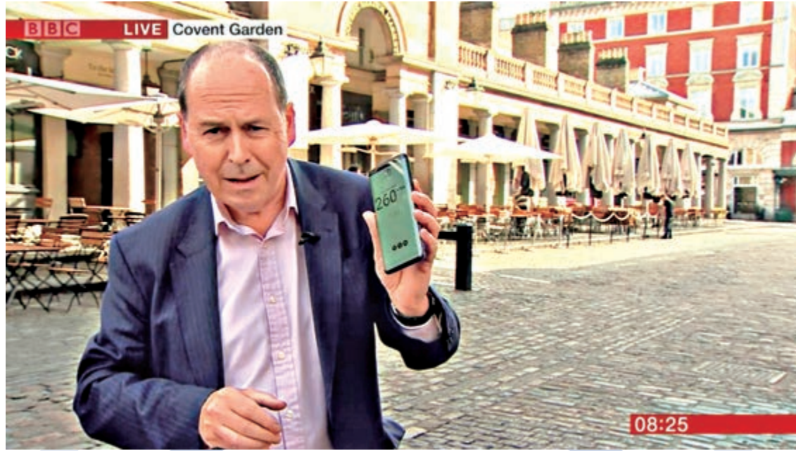
▲BBC借助華為5G服務，搶先進行英國國內首次5G新聞直播