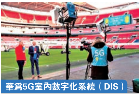
華為5G室內數字化系統 (DIS) 對於足球場、商場等室內場景，還將使用華為5G室內數字化系統