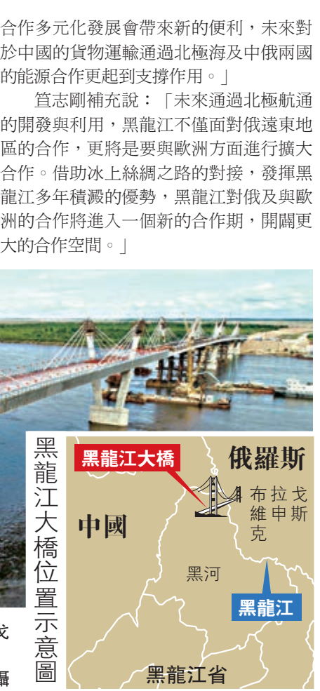
▲中俄首座跨境公路大橋黑河—布拉戈維申斯克黑龍江大橋合龍 大公報記者于海江攝