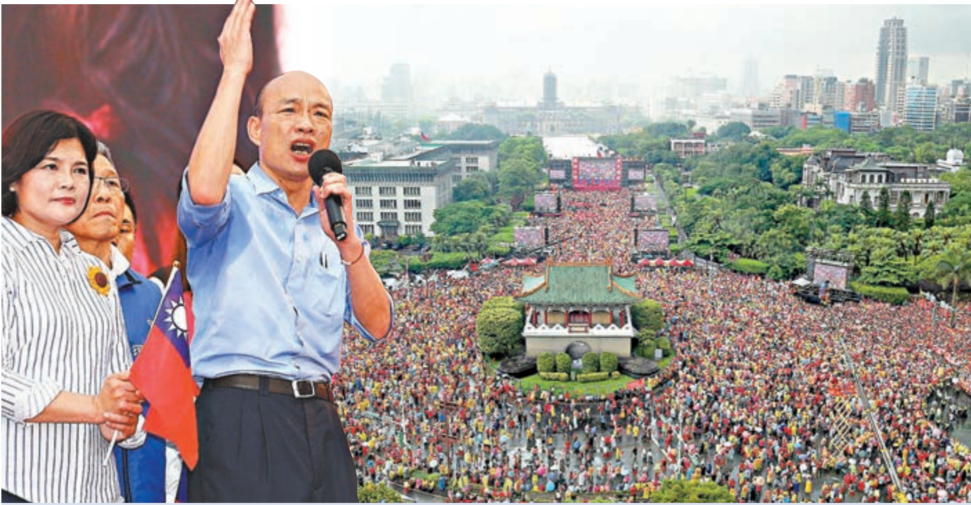
▲韓國瑜造勢會致辭宣布2020將承擔重任，呼籲民眾團結將民進黨趕下台 網絡圖片

台灣競爭力論壇理事長龐建國教授認為，這場造勢活動讓韓國瑜重拾舞台，某種程度有着「韓流」再起的意味，再加上他的演講主要衝着蔡英文而來，等於是參選台灣領導人的誓師大會。對於韓國瑜參選台灣領導人的氣勢而言，的確有加分作用。