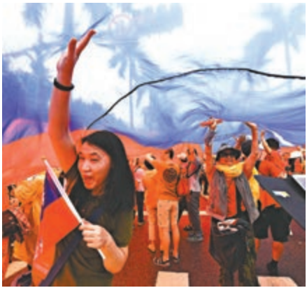
▲參加造勢活動的民眾在現場拍照留念

林定芃亦認為，韓國瑜提出把民生經濟列為優先項目，把自由貿易協定的雙邊簽訂逐一落實，這確實是台灣經濟的出路，方向是正確的。而設置自由貿易區能夠在人流、物流、資金流和資訊上產生跨境便利性，讓更多資源和機會進來，創造更