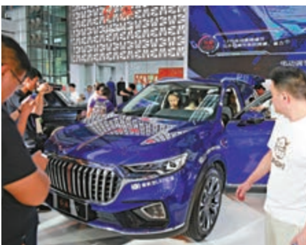
▲6月1日，2019深港國際車展在深圳會展中心開幕，為粵港澳大灣區呈現一場精彩的汽車文化盛宴

遇、大文章。如今，大灣區建設步伐日益加快，無論是服務、創新、市場，還是轉型升級方面，都能為台企提供全新的動能。文章指出，台灣毗連粵港澳大灣區，參與其中，既符合經濟規律，又符合協同互補優勢，更是台灣民生福祉的需求所在。粵港澳大灣區作為一個國際型平台，將成為大陸參與「一帶一路」建設的重要支撐，有助於企業全球化發展，也必然會對台灣產生輻射影響力，進而帶動兩岸經貿轉型升級，就連新一代台灣青年都懂得學會漢語、英語、粵語三語言可以讓他們在世界職場上更具競爭力。更何況，這裏還有很多「同等待遇」與「廣東紅利」？