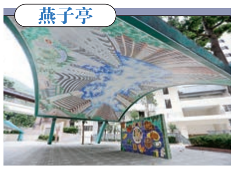
▲燕子亭天花畫上了舊蘇屋邨的面貌，這也是全港獨一無二的3D公共天花壁畫