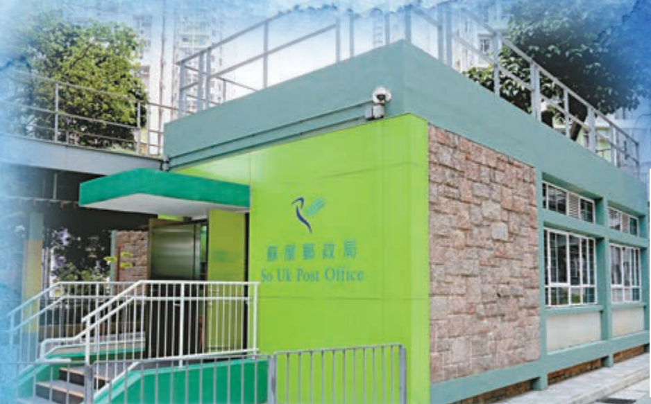
▲前身是屋邨辦事處的蘇屋郵局，保留了1960年至今的兩面麻石牆壁、兩排牆身白色瓷磚及兩扇鐵窗