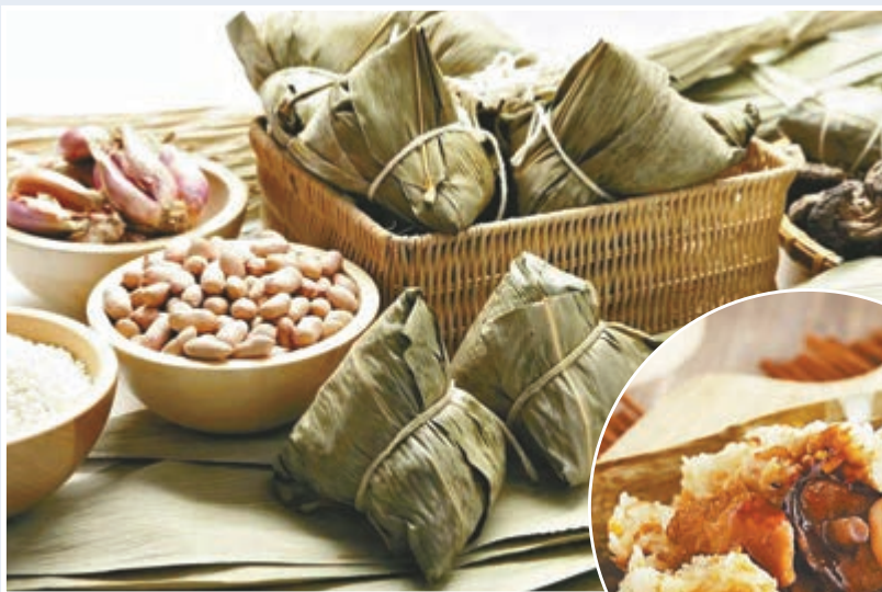
▲端午糉子飄香 資料圖片

蘆兜糉用傳統食料，鴨蛋黃、五花腩肉，冬菇，或加入瑤柱，蒸七至八小時，過程繁複，本港只有少數食肆製作。