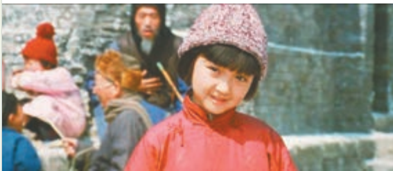
▲《城南舊事》講述了小女孩英子的童年故事，亦成為一代人的經典回憶

宋媽、爸爸，他們都是給小英子留下美好回憶的人，卻又在不經意間離開了。經歷了離別之傷、成長之痛的小英子，也在一天天的長大，童年的那些人、那些事也被她記錄下來，記在了她的心裏，記在了她的《城南舊事》裏。