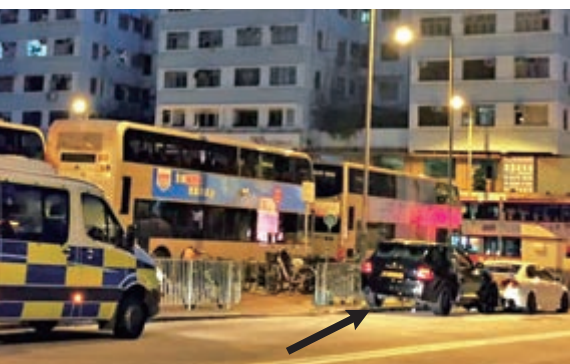
▲保時捷四驅車（箭嘴示）事後停在路旁 網上圖片