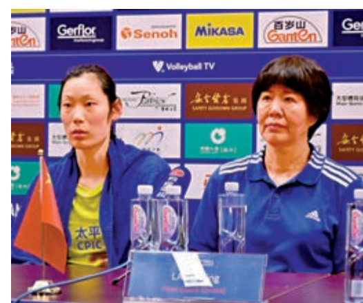
▲郎平 (右) 和朱婷出席賽後記者會