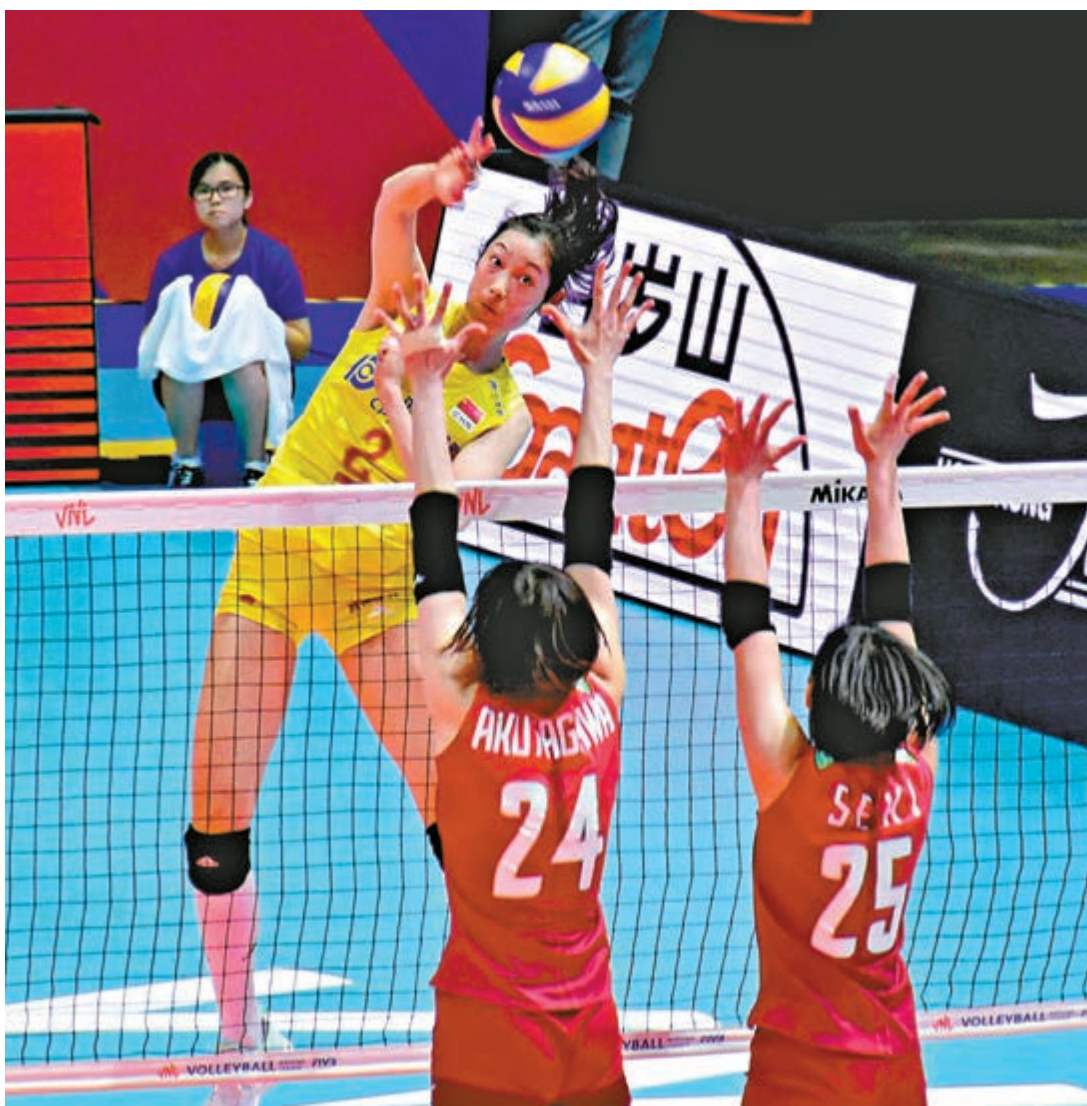
▶中國女排朱婷(上)大力扣殺