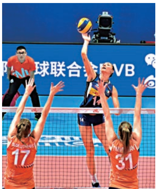
▲意大利隊比珍妮(上)扣殺成功