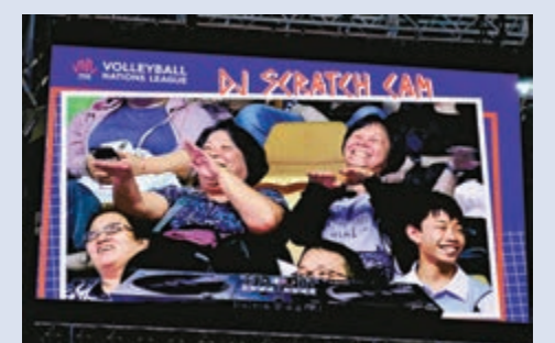
▲兩位阿姨在大屏幕互動環節玩得亦不樂乎

昨晚的賽事，場上女排運動員進行了激烈的比拼，觀眾亦為她們鼓掌打氣。另一方面，在比賽過程中，與現場觀眾的互動也是非常多。記者發現，在比賽暫停時，場內大屏幕鏡頭對準現場觀眾，屏幕裏配上DJ打碟的設備，讓鏡頭裏的現場觀眾做出打碟的姿勢，有兩位阿姨居然在此互動環節玩得亦不樂乎，現場瞬間充滿掌聲，大家都在互動中玩得非常開心。（大公報記者張銳 文、圖）