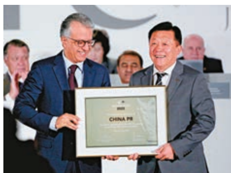
▲薩爾曼(左)向杜兆才頒發2023亞洲盃承辦權證書

亞足聯主席薩爾曼向中國足協表示祝賀，他表示，這對亞洲足球的發展是一個重要時刻，有助於激發足球運動在中國這一世界人口大國的發展潛力。