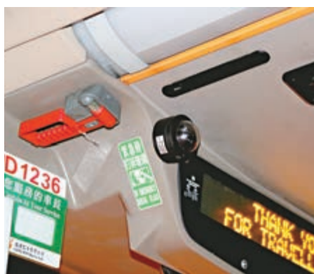
▲九巴「刺客」再現，警方事後翻看巴士內「天眼」蒐證

黃先生（在機場上班）：「未聽聞呢條巴士線有人放針拮人，最驚係專登放位置受感染血針筒，希望巴士公司聘請多些清潔工人和巡查人士。」