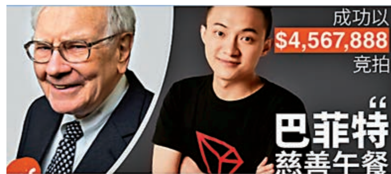
▲有言論認為，孫宇晨欲改變巴菲特對比特幣為「老鼠毒藥」的看法，成功機會較低

在以往的19次巴菲特午餐拍賣活動中，共有3名華人先後拔得頭籌，分別是2006年的步步高創始人段永平、2008年的「私募教父」趙丹陽和2015年的天神娛樂前董事長朱晔。觀看他們午餐後的人生軌跡，當年馬雲也被人當騙子。有的繼續人生得意，有的身陷囹圄。孫宇晨還很年輕，祝賀他，祝福他。