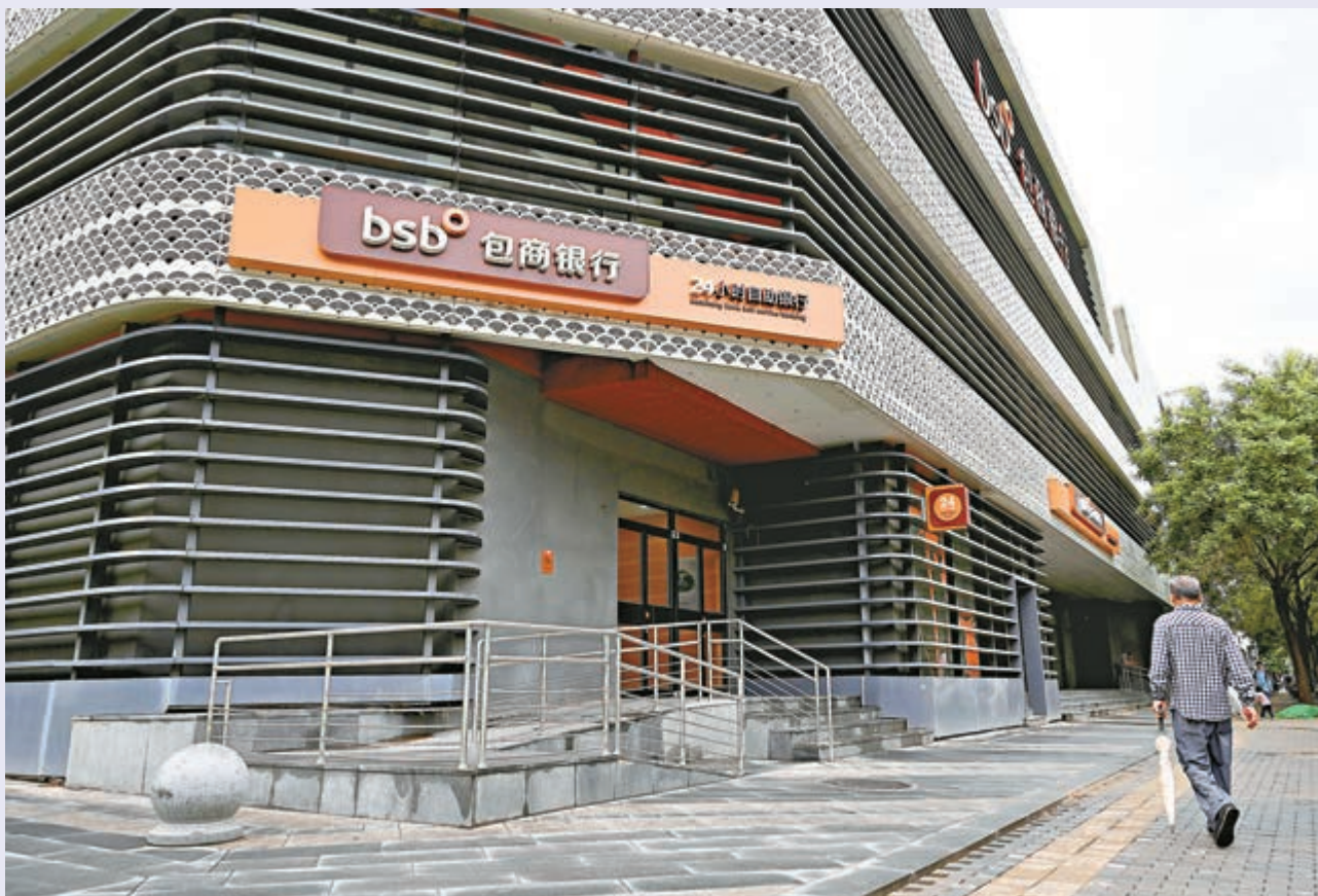
▲中國人民銀行、中國銀保監會依法對包商銀行實施接管