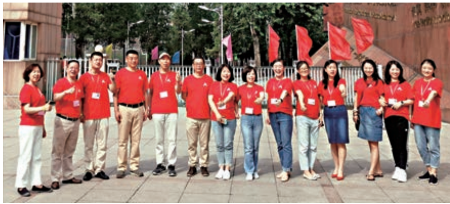
▲人大附中分校的老師送考團為考生加油打氣