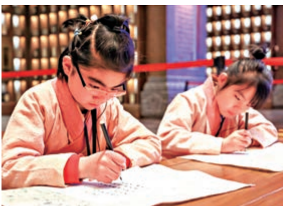
▲研學學生在尼山聖境體驗手讀論語

去年暑假時，孟琳和她的團隊剛剛涉足研學旅遊，當時一個月也就能出一個研學團。但今年3月份以來，每周都會有一到兩個研學團。