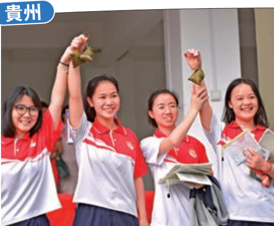
6月7日，在貴州省從江縣第一中學考點，考生舉着「粽子」合影留念