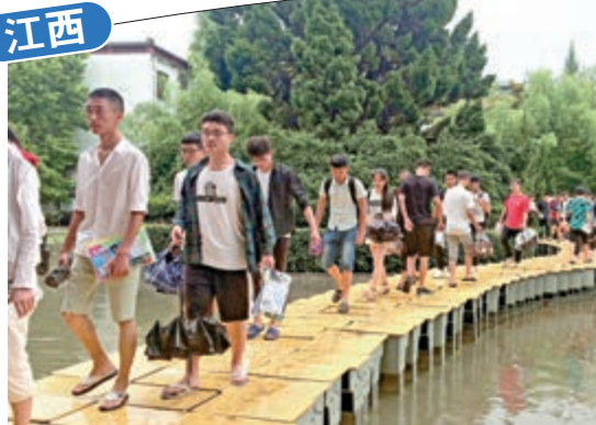
6月7日，在江西省上饒市玉山縣玉山一中考點內，考生們通過「浮橋」進入考場