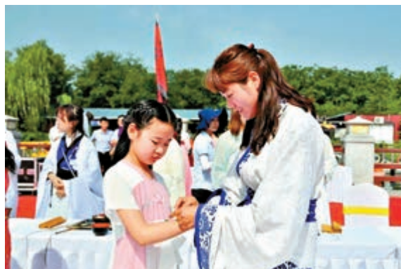
▲端午節繫五彩繩寓意幸福安康

對於中國人來說，端午勾起的不僅是美味的誘惑，更多的是思親之情和思鄉之情，糉子作為端午節的專屬，同樣承載着太多的記憶。現場民眾在專業老師的帶領下，紛紛動手包起糉子。大家把對美好生活的期許，也全部包裹進了糉子中。