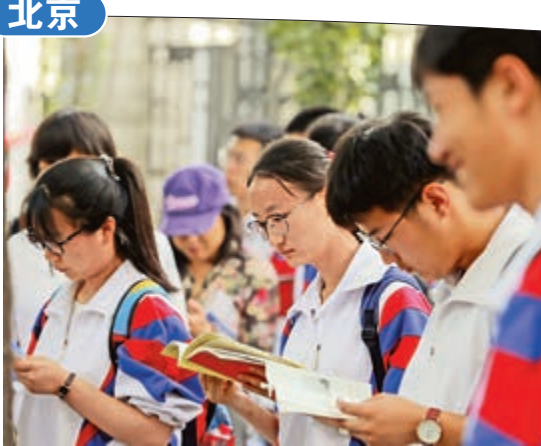
6月7日，北京一考場外，考生入場前複習