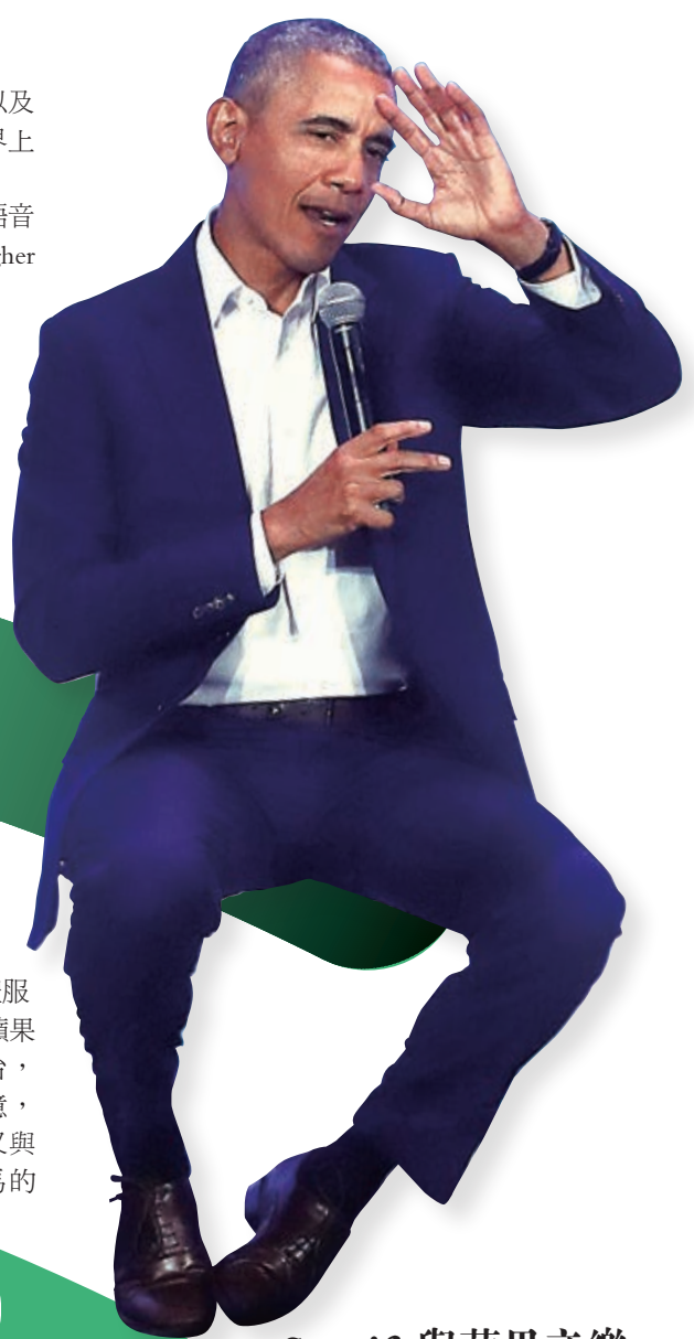
▶美國前任總統奧巴馬將在Spotify推出語音節目

除了尋求在語音節目上的發展，Higher Ground在2018年春季亦宣布與Netflix簽訂一份為期多年的協議，製作系列劇集及影片節目，包括以第二次世界大戰為題的劇集及美國紀錄片等。