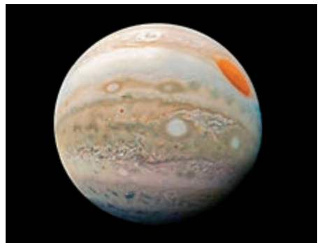
▲木星本月將最大最明亮

，可更近在咫尺般感受這顆星球。水星和火星將於美國當地時間6月17日至18日的日落後在視覺上極度靠近，只需要在西地平線即可清晰看到，這兩顆行星將只比地平線高幾度。