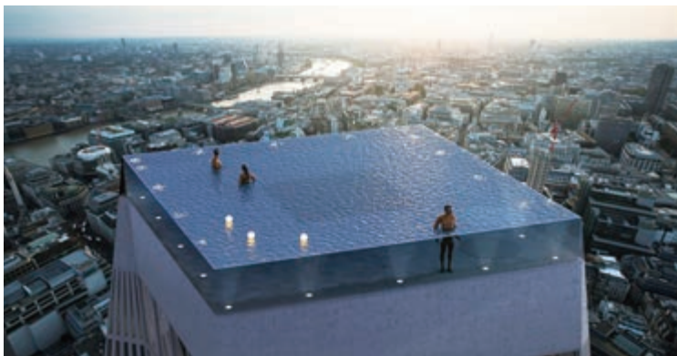
▲三百六十度無邊泳池概念圖

還內置風速監測器，同時加熱系統還能夠為水加熱。Compass Pools表示，如果可以確認所有項目合作夥伴和承包商，最早會在明年開始動工，不過無限泳池大廈的位置尚待確認。