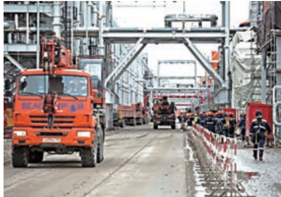
▲中俄亞馬爾項目第二條生產線液化氣去年8月8日首次裝船 資料圖片

【大公報訊】記者海慶、于江報導：中石油和中海油7日與俄羅斯最大獨立天然氣生產商簽訂北極LNG2項目的股權購買協議，分別收購諾瓦泰克主導開發的北極液化天然氣（LNG）出口項目10%股權，中俄北極能源合作加速推進。此番中石油和中海油入股的北極LNG2位於俄北極圈內格丹半島，是諾瓦泰克在北極圈開發的第二個大型陸上常規LNG項目，LNG加工能力為1980萬