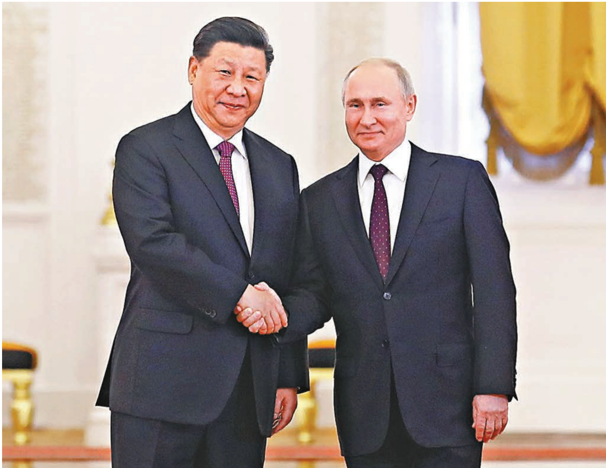
6月5日，俄羅斯總統普京在莫斯科克里姆林宮喬治大廳為中國國家主席習近平舉行隆重歡迎儀式

●習近平同普京一道出席中俄建交70周年紀念大會並觀看文藝演出 【新時代的中俄關係，要始終以互信為基石，築牢彼此戰略依託。牢固的政治互信是中俄關係最重要的特徵，堅定的相互支持是兩國關係的核心價值。我們要像愛護自己的眼睛一樣，珍惜和呵護雙方建立起來的真實互信。】