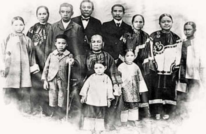
▲澳門是孫中山迎向世界窗口、成長學習、針砭朝政、懸壺行醫、宣傳革命及家人、親屬安居之處所。圖為孫中山（後排右四）與家人合照