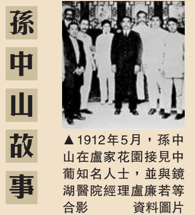
▲1912年5月，孫中山在盧家花園接見中葡知名人士，並與鏡湖醫院經理盧康若合影 資料圖片