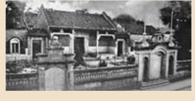
▲圖為1871年的鏡湖醫院 資料圖片

孫中山在澳門行醫時間雖然不長，但在此期間，他結識了維新改良派開明人士，獲得了眾多華商名紳、土生葡人精英和家族的支持。這段經歷，對他早期革命思想的形成產生了深遠影響，也推動了他由「醫人」向「醫國」的重要轉變。