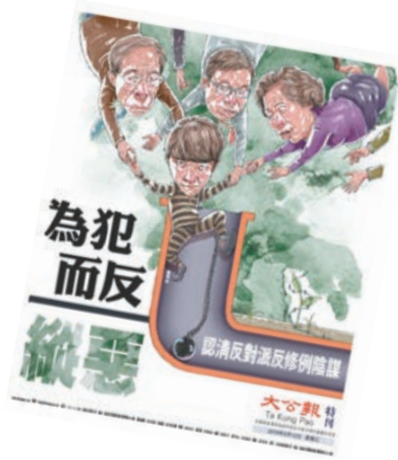
▲大公報昨日推出漫畫特刊，戳破亂港陰謀，獲得各界人士一致好評

【大公報訊】大公報昨日推出以「為犯而反縱惡」為主題的漫畫特刊，戳破反對派勾結「新八國聯軍」、借反修例亂港的陰謀，獲得政界人士和網友的一致好評。