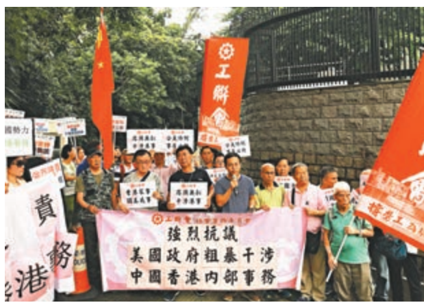
▲工聯會批評美國指修例將侵蝕香港「一國兩制」的言論，全是罔顧事實