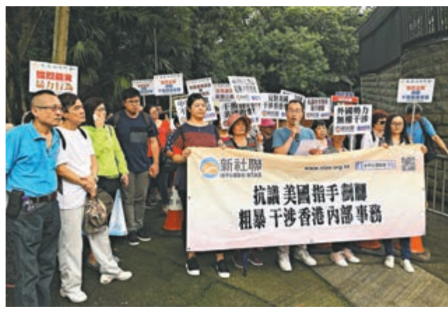
▲新界社團聯會批評，美國政府無視事實，詆毀「一國兩制」

【大公報訊】外國勢力藉修訂《逃犯條例》干涉香港內部事務惹起全城不滿！本港社會不同界別代表團體連日來持續去到美國駐港總領事館示威，抗議美國國務院近日不斷就修例妄加議論，形容美國是反對修例的「幕後黑手」，憑藉播失實言論抹黑及妖魔化修例，煽動青年上街，製造社會紛爭混亂。示威團體又促請，政府盡早完成修例，堵塞法律漏洞，並支持警方嚴正執法。