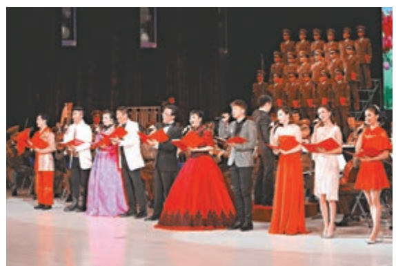
▲2018年11月3日，中朝文藝工作者首場聯合演出在朝鮮平壤萬壽台藝術劇場舉行 資料圖片

外交部有關負責人還介紹了中朝兩國各領域主要合作情況，表示中朝關係和兩國人民友誼長期穩定發展得益於兩國山水相連的地緣優勢及良好的政治關係、民間友好基礎和經濟互補性。今年雙方商定共同舉辦一系列活動慶祝中朝建交70周年，通過回顧歷史、規劃未來，爲新時代中朝關係發展注入新動力。