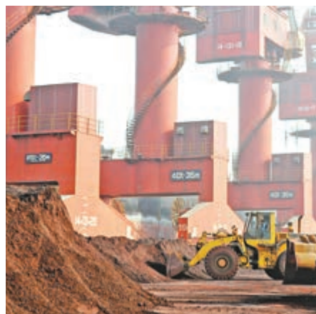
▲17日，發改委稱，中國願意以稀土資源和產品滿足世界各國發展的正當需要。圖為在江蘇省連雲港市，工人正在運輸稀土 資料圖片

【大公報訊】記者張寶峰北京報道：國家發展改革委新聞發言人孟瑋17日說，中國願意以稀土資源和產品滿足世界各國發展的正當需要。但是，「如果有誰企圖利用中國稀土資源所製造的產品，反用於遏制打壓中國的發展，我們堅決反對。」