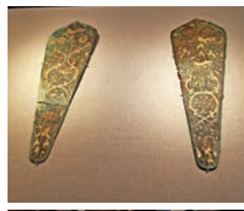
▲銅錯金神獸紋當盧