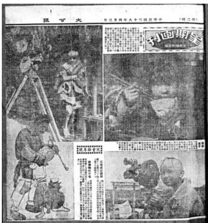
▲《三毛流浪記》修復版登上大銀幕