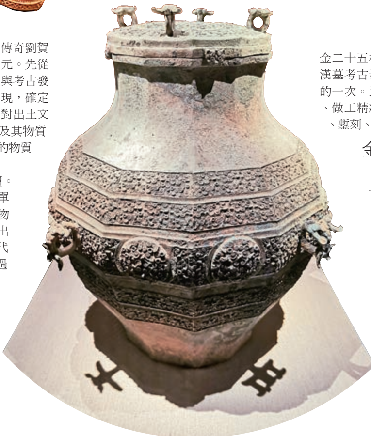
▲十二枝蟠螭紋銅缶

是次展覽中，最引人矚目的莫過於劉賀墓中出土的大量黃金。劉賀墓共出土金器四百七十八件，合計一百一十五公斤，其中金餅三百八十五枚、馬蹄金四十八枚、麟