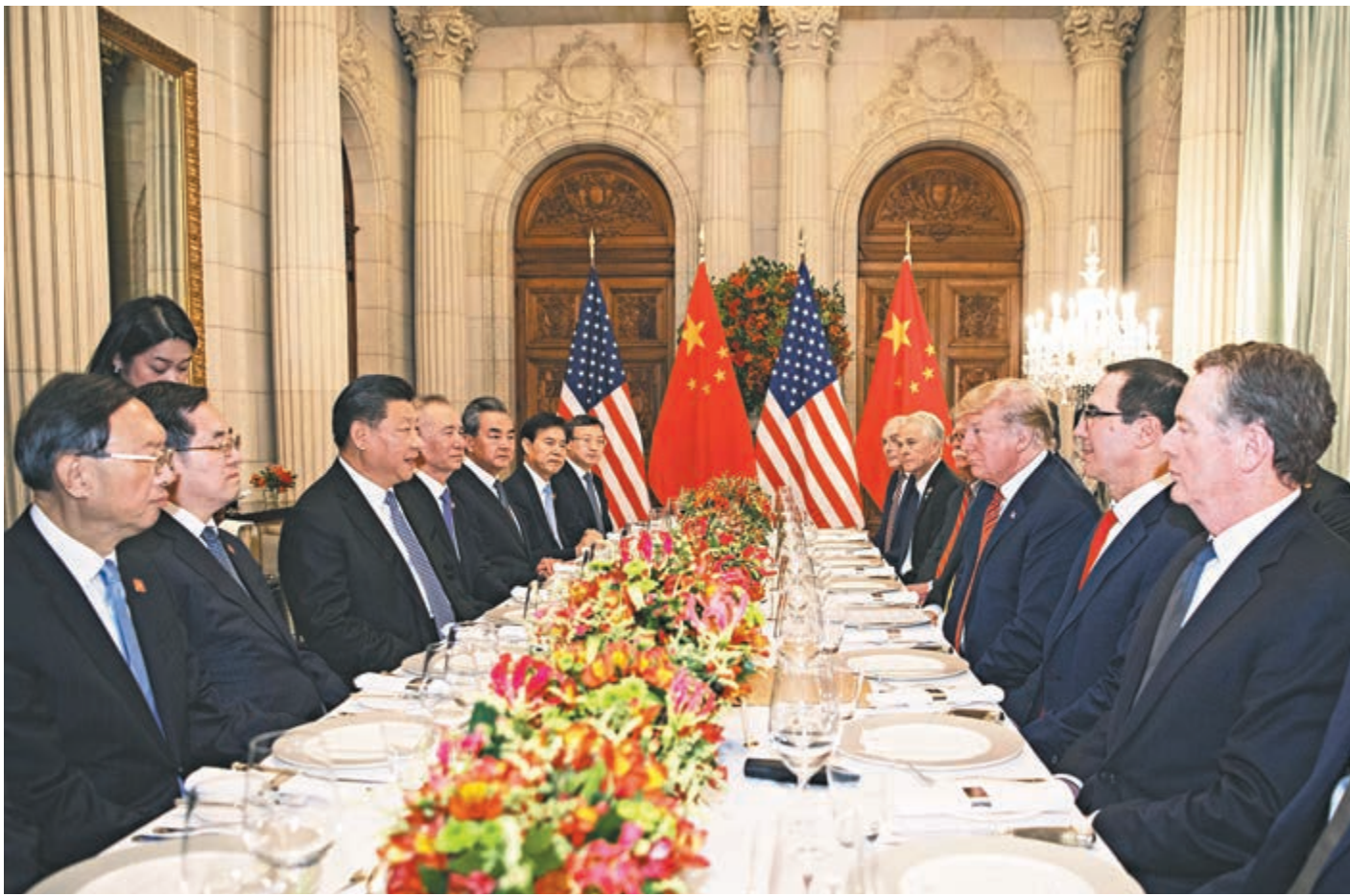
▲2018年12月1日，國家主席習近平應邀同美國總統特朗普在阿根廷布宜諾斯艾利斯共進晚餐，舉行會晤。資料圖片

希望美方在G20大阪峰會期間認真聽一聽國際社會對單邊主義、保護主義和霸凌行徑的抵制聲音。我們希望美方同中方相向而行，在相互尊重、平等互利的基礎上，照顧彼此合理關切，爭取互利共贏。這不僅符合中美兩國及兩國人民的利益，也是國際社會的普遍期待。