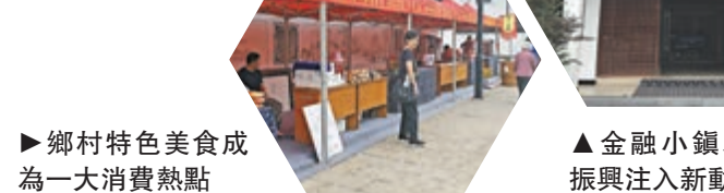
► 鄉村特色美食成為一大消費熱點