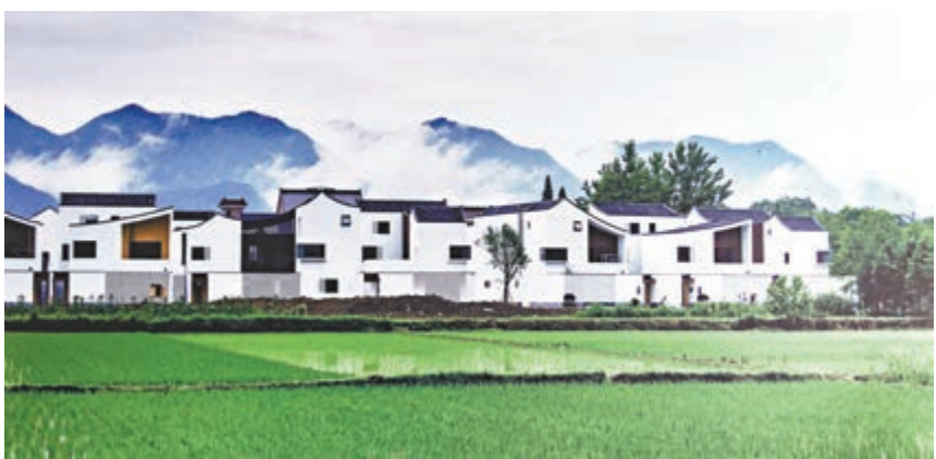
▲ 新杭派民居猶如一幅現代版「富春山居圖」