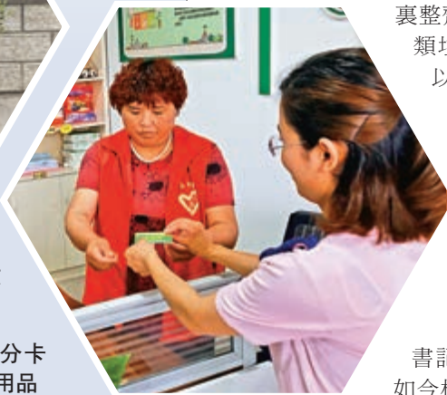
► 村民拿着積分卡到超市兌換日用品