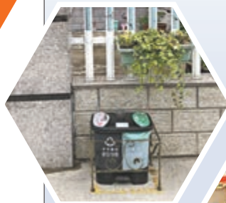
▲ 長興港口村家家戶戶門口都整齊地擺放着分類垃圾桶