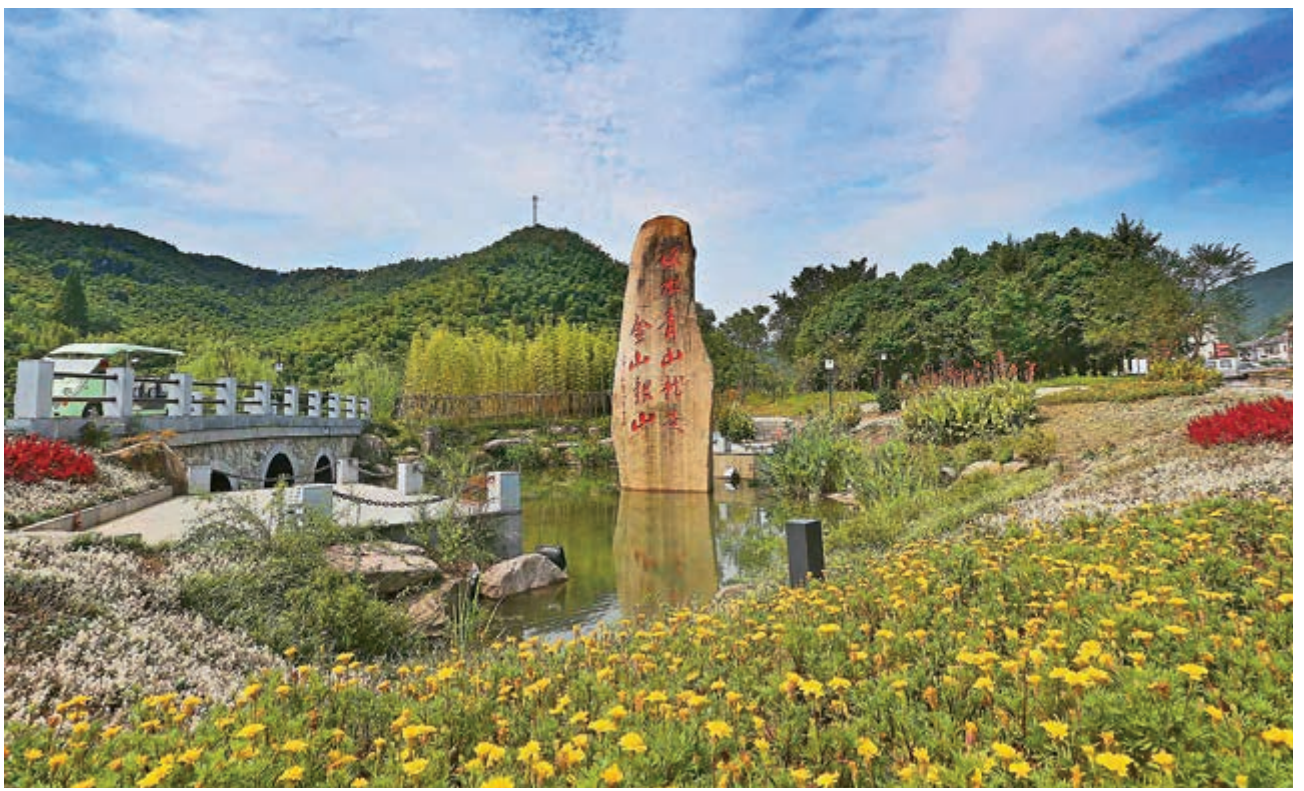
▲ 浙江始終踐行「綠水青山就是金山銀山」理論，走出一條山水美農民富的鄉村振興之路 資料圖片