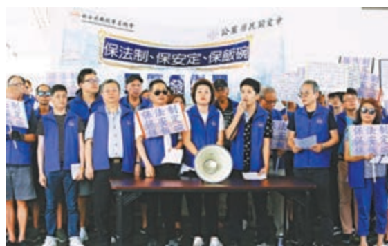
▲香港的士司機從業員總會及香港公屋居民關愛會昨日到中環碼頭請願。