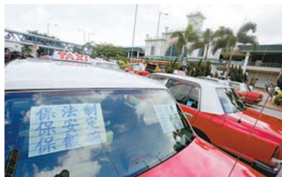
▲「的總」發動會員在1000輛的士車身上張貼「保法制、保安定、保飯碗」標語

【大公報訊】記者謝瑩瑩報導：近日連串遊行示威、堵路包圍衝擊行動，不僅加劇社會撕裂，更嚴重影響的士司機生意。香港的士司機從業員總會、香港公屋居民關愛會表示，市區的士司機損失最慘重，每日損失高達30%至40%生意，過去兩星期已收到800宗的士司機求助。團體呼籲市民停止對抗，理性表達訴求，讓的士司機可「保住飯碗」。