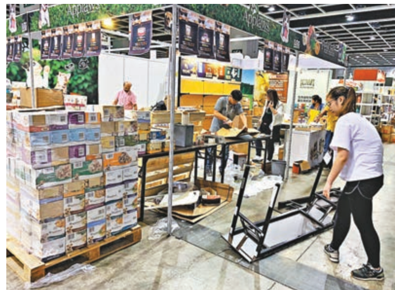
▲原定為期三日的寵物展及家居博覽要提前結束，職員昨晚忙於搬貨離開會場