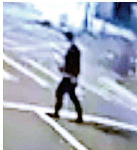
▲狂徒上月在灣仔軍器廠街及駱克道交界，將汽油彈投向一架警車