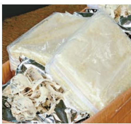
▲水警及海關在西貢檢獲的走私貨物包括一批燕窩

海關港口及海域科海域調查組指揮官梁耀文表示，這是今年警方及海關聯合搗破的第十宗走私電子零件案。而在十宗案件中，檢獲貨物共值4200萬元。檢獲的走私貨物會向法院申請充公，並根據程序進行拍賣。