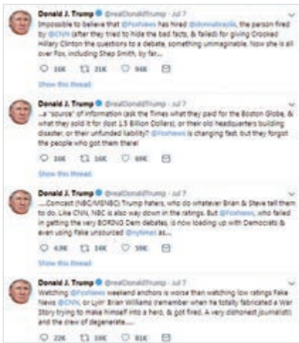
▲美國總統特朗普7日在推特上接連發文，大力抨擊霍士新聞

【大公報訊】據美聯社報道：美國總統特朗普向美媒猛烈開火已經不是一兩次的事了，但他7日竟在推特上接連發文，大力抨擊「盟友」霍士新聞（Fox News），指責對方偏袒民主黨、引述《紐約時報》誇張的報道等，批評霍士新聞「忘恩負義」。如此尖銳的批評還是頭一遭。