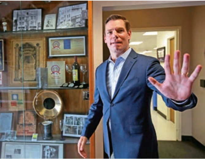
▲美國加州聯邦眾議員斯沃韋爾8日宣布退出2020年美國總統大選

沃倫7日宣布，她的競選團隊在第二季籌得1910萬美元（約1.5億港元）競選經費，比桑德斯和賀錦麗的籌款數字都多，但略少於拜登的2150萬美元（約1.7億港元）。