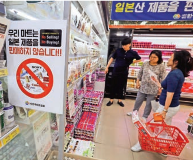
▲日韓關係緊張之際，韓國超市貼出抵制日貨的標識

美國商務部在一份聲明中指出，中國和墨西哥去年出口美國的預製結構鋼材總值達15億美元（約117億港元），其中中國佔8.975億美元，墨國佔6.224億美元。