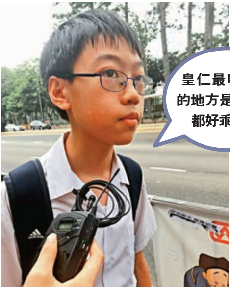
▶林同學獲派第一志願英皇書院，他坦言會向皇仁叩門