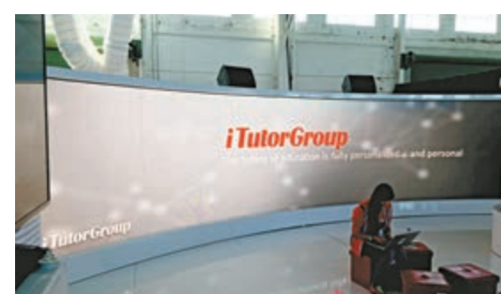
▲平安子公司平安海外 (控股) 將入股在線教育集團iTutorGroup

iTutorGroup將與平安集團共同推進AI技術在教育領域的應用，推動在線教育行業高質量發展。中國平安表示，公司一直關注教育領域的發展與機遇；今次入股的順利完成，預期將為智慧教育注入新的力量，進一步完善智慧教育業務版圖。