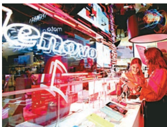
▲聯想電腦出貨量1625萬台，按年增長18.2%

值得注意的是兩家研究公司的數據都是以「出貨量」計算，而非實際銷售數字，故此亦難以反映真實情況，部分公司或因貿易戰而增加庫存，故次季表現因而較好。