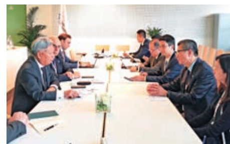
▲陳茂波在盧森堡與亞投行情長金立群（左一）會面時表示香港將繼續在亞投行運作發揮積極作用。

投行情長金立群會面時表示，香港將繼續在亞投行運作發揮積極作用。陳茂波在年會中與國家財政部部長劉昆會面時表示，歡迎財政部在香港發行人民幣國債，以鞏固全球離岸人民幣業務樞紐地位。