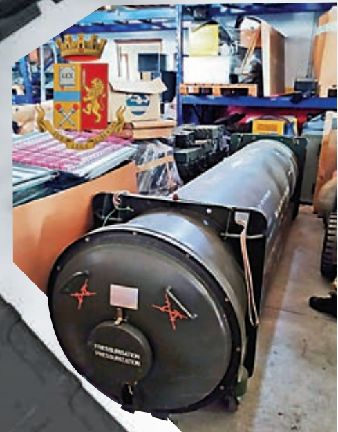
▲Super 530 中程空對空導彈

根據意大利一般調查和特別行動部（DIGOS）所發聲明，一批有極端主義背景的意大利人近來活動頻繁，警方原本要調查他們是否參與烏克蘭東部頓巴斯地區的武裝衝突。但在追查一年以後，卻於15日通過線人找到了這座位於北部帕維亞省的「地下軍火庫」，同時逮捕了三名涉案人員。