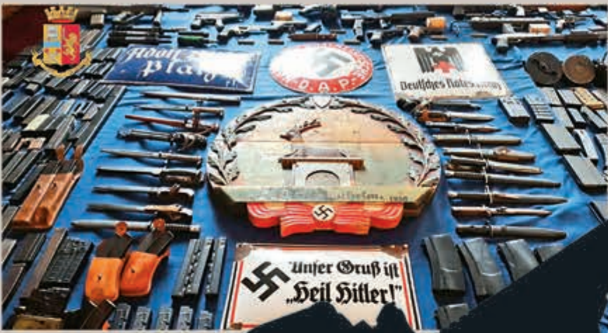
▲意大利警方在新納粹軍火庫發現的大批武器