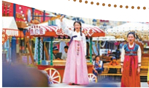
▲17日，「快閃合唱」活動在哈爾濱中央大街 亮相