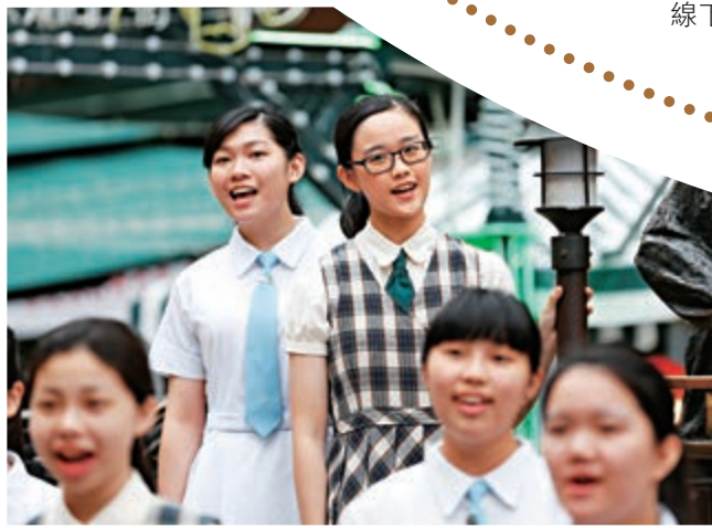
▲港澳青少年合唱團在哈爾濱中央大街用粵語合唱一曲《好歌獻給你》 中新社 亮相