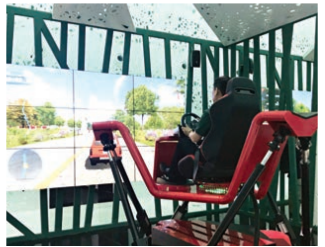
▲粵港澳大灣區主打科技創新。圖為台商在大灣區體驗VR遊戲產品